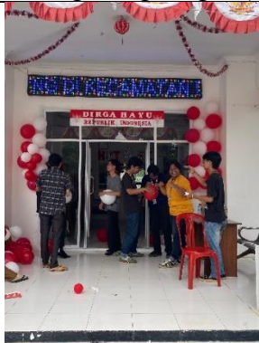
Kegiatan menghias kantor kecamatan acara 17 Agustus-an