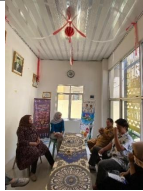
Kunjungan DPL ke kantor kelurahan Sumbersari. (Bersama Mahasiswa kelompok)