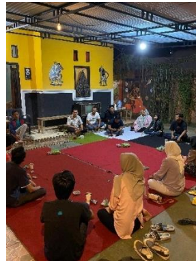
Pertemuan dengan panitia serta remaja dari jajaran karang taruna.