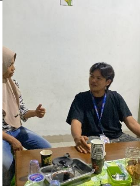
Pembuatan Akun Sosial Media (Instagram dan Facebook Marketplace) UMKM Kopi Keling (Part II)