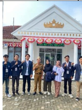
Kegiatan apel pagi di kantor kecamatan bersama dengan anggota kelurahan dan camat