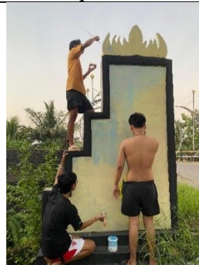
Pengecatan Gapura Selamat Datang Sumbersari Bantul