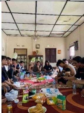
Rapat kegiatan workshop bersama kelompok lain yang berada di Metro Selatan (Part II)