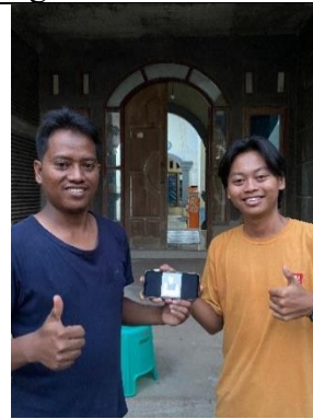
Penyerahan Logo UMKM Jamur Merang Mas Gagah