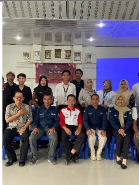
Kegiatan rapat 'Pleno (Pemilihan calon gubernur/wakil gubernur)