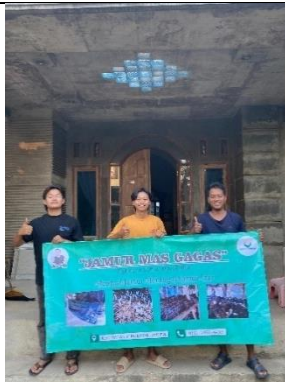
Pemasangan Banner UMKM Jamur Merang Mas Gagah