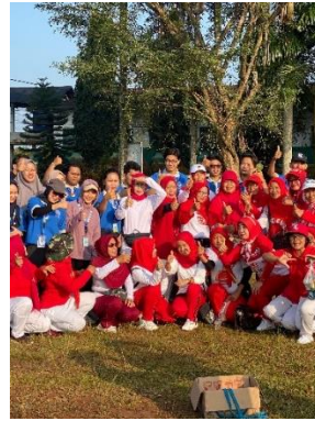
Senam lansia yang diselenggarakan 'Lansia Sehat Metro Ceria' PMI.