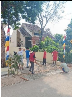
Kegiatan bersih-bersih kelurahan sumbersari Bantul