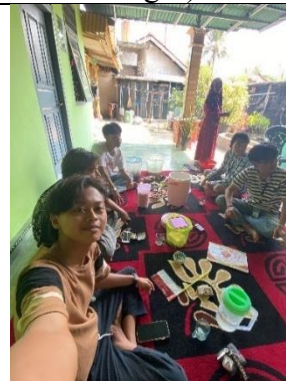
Acara makan Bersama ibu-ibu KWT > Berhasil meraih juara 2 dalam kontes Fashion