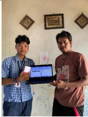
Penyerahan laporan keuangan sederhana pada UMKM Jamur Merang Mas Gagas