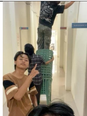
Kegiatan menghias kantor kelurahan acara 17 Agustus-an