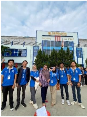
Acara pelepasan Mahasiswa PKPM di Lapangan Basket IIB Darmajaya