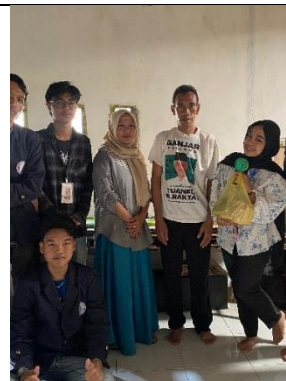
Survey UMKM pembuatan Tempe