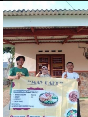
Pemasangan Banner May Cake (Jajanan Pasar)