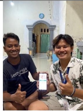
Survey UMKM Jamur Merang (Pengambilan Dokumentasi)