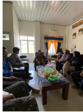
Pertemuan DPL Bersama peserta PKPM dengan bapak lurah di kantor kelurahan sumbersari Bantul.