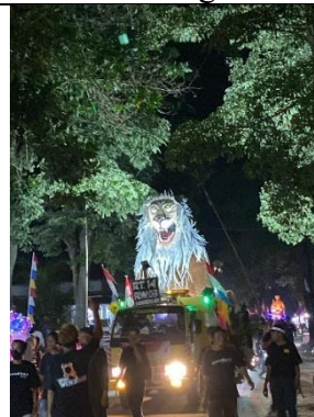
Kegiatan pawai 17-an di lapangan sumbersari dan mengatur arus jalur masuk kendaraan pawai dan non-pawai