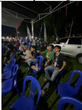
Kegiatan melihat pawai 17-an di kelurahan margodadi