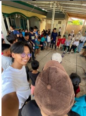
Kegiatan pengawasan panitia lomba ibu/anak-anak