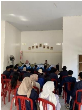
Kegiatan pembahasan seputar PKPM di kantor kecamatan.