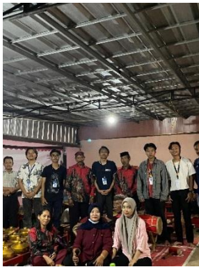
Kegiatan penutupan Suroan dengan menampilkan musik khas Jawa