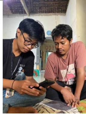
Pembuatan account Google My Business pada UMKM Jamur Merang Mas Gagas