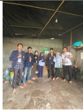
Survey UMKM Kopi Keling (Aneka jenis produk Kopi)