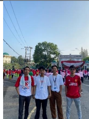
Mengikuti acara senam ber-temakan Car Free Day di metro pusat