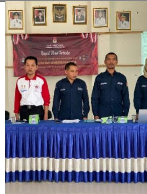
Pemantapan pawai di kantor kelurahan dan aturan dalam melaksanakan pawai 17-an