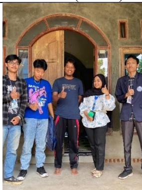
Survey UMK penghasil Jamur Merang