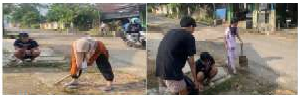
Gambar 2.22 Gotong Royong bersama di Dusun Wiyono

Mengikuti kegiatan gotong bersama di Dusun Wiyono