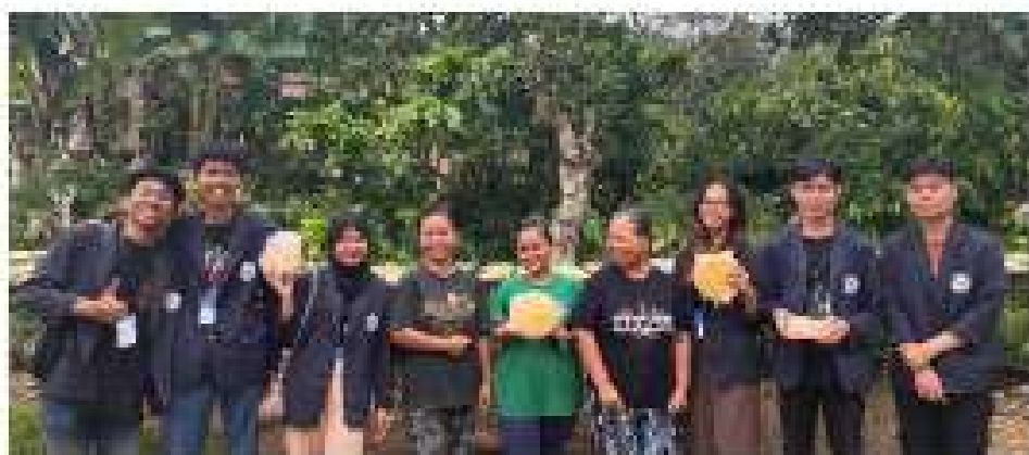
Gambar 2.11 Kunjungan ke UMKM Opak

Berkunjung ke UMKM Opak Mama Cheri sekaligus meminta izin untuk membantu mengembangkan usahanya.