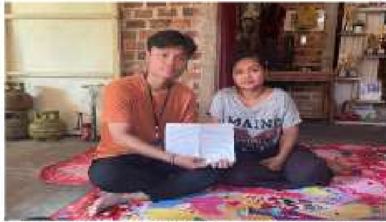
Gambar 2. 2 Pelatihan Perhitungan HPP dan Laba Rugi