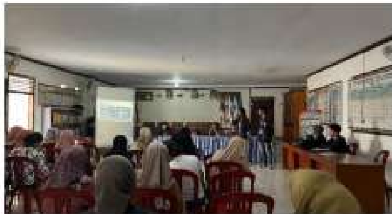
Gambar 2.3 Seminar Digitalisasi UMKM

Target peserta dalam kegiatan ini yaitu Pelaku UMKM di Desa Wiyono dengan tujuan agar para pelaku UMKM di Desa Wiyono bisa lebih berkembang. Adapun materi yang disampaikan dalam seminar tersebut yaitu deskripsi UMKM, Branding, E-Commerce , Media Sosial serta Konten Marketing.