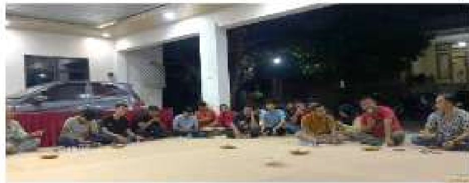
Gambar 2.17 Rapat Persiapan HUT RI ke-79