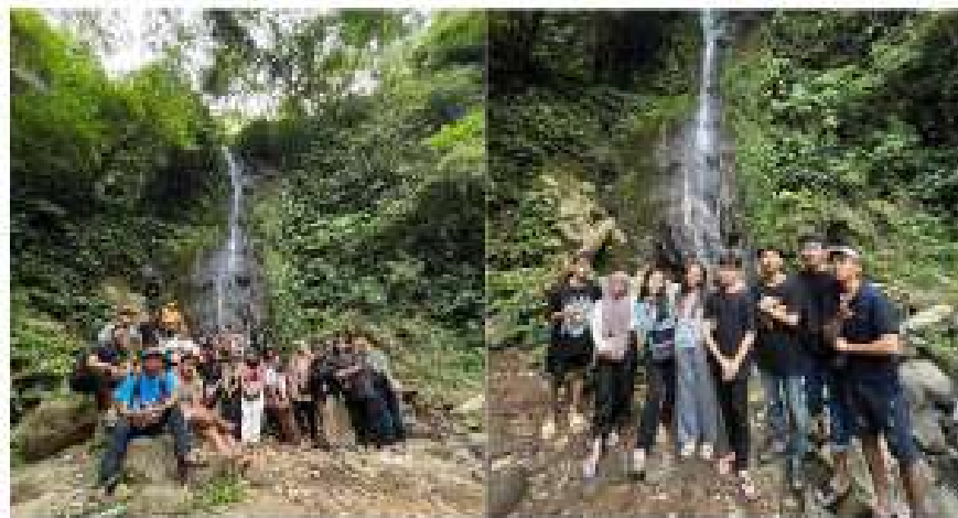
Gambar 2.13 Kunjungan ke Wisata Air Terjun Gunung Betung