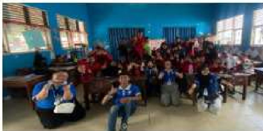
Gambar 2. 5 Kunjungan SDN 01 Gedong Tataan

Berkunjung ke SDN 01 Gedong Tataan memberikan motivasi belajar dan bermain game.