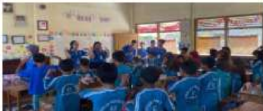
Gambar 2.6 Kunjungan ke SDN 12 Gedong Tataan

Berkunjung ke SDN 12 Gedong Tataan memberikan motivasi belajar dan bermain game.