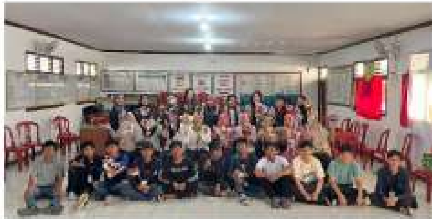
Gambar 2.4 Pelatihan Bucket Snack