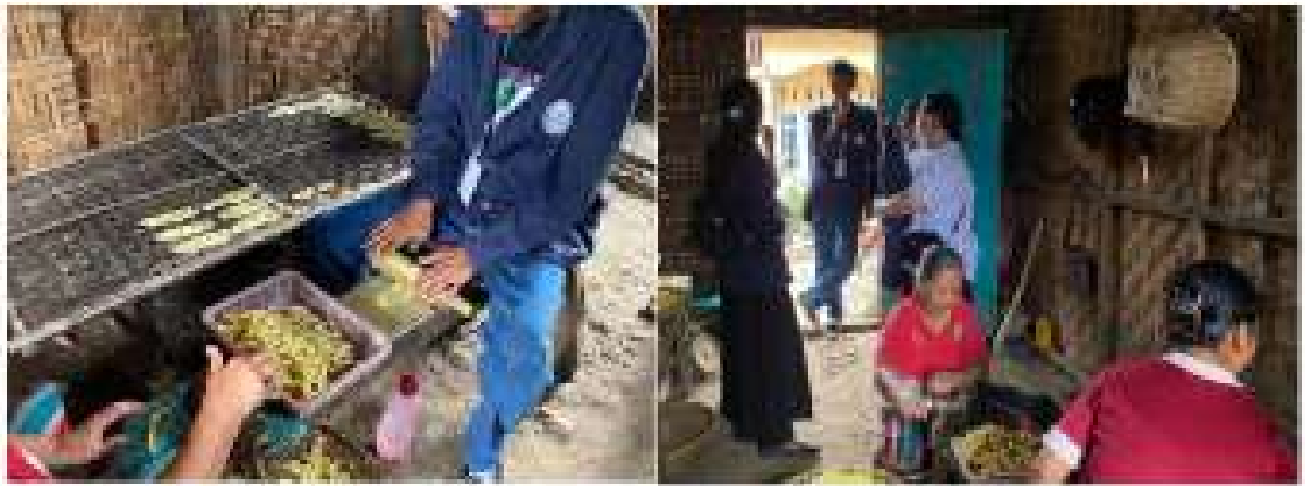
Gambar 2.9 Kunjungan ke UMKM Kelanting