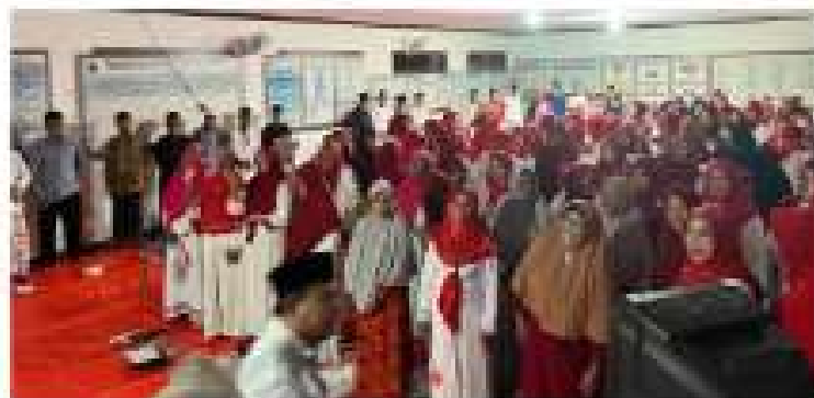
Gambar 2.21 Pengajian rutin ibu-ibu Desa Wiyono

Mengikuti pengajian rutin ibu – ibu setiap hari sabtu.