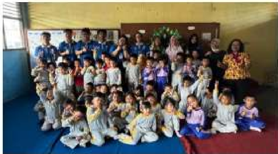
Gambar 2.7 Kunjungan ke TK Dharma Wanita

Berkunjung ke TK Dharma Wanita belajar berhitung sambil bermain game