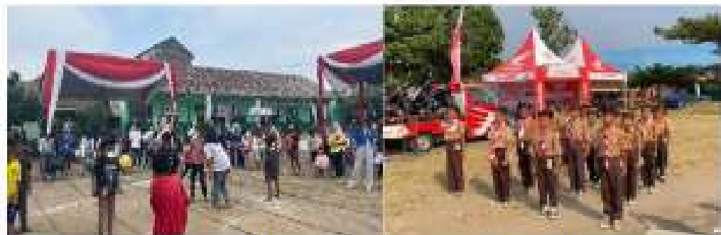
Gambar 2.18 Menjadi koordinator gerak jalan dan perlombaan