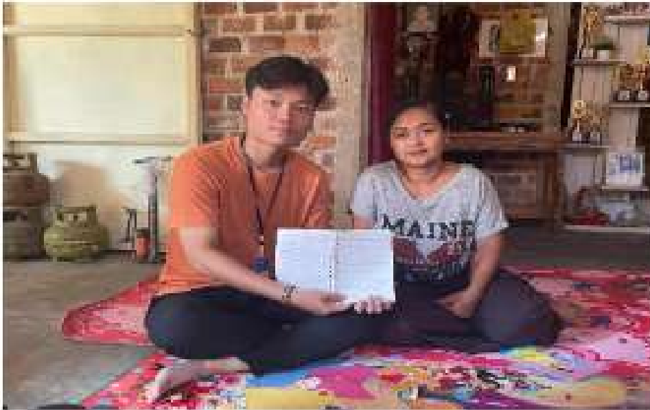
Gambar 2.1 Pelatihan pencatatan transaksi menggunakan Buku Kas

terkait informasi keluar dan masuknya arus kas usaha, baik secara tunai maupun kredit.