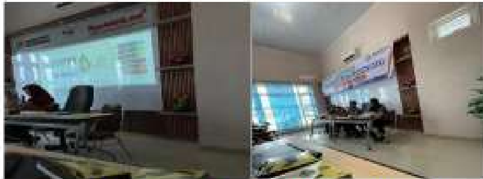
Gambar 2.14 Mengikuti Pembinaan Desa Cantik BPS Statistik

Menjadi perwakilan kelompok PKPM Kecamatan Gedong Tataan untuk mengikuti pembinaan Desa Cantik BPS Statistik.