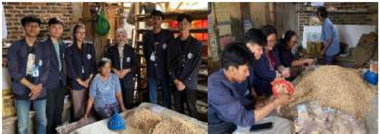
Gambar 2.8 Kunjungan ke UMKM Produksi Tempe

Berkunjung ke UMKM Produksi Tempe dan membantu proses pembuatan tempe.