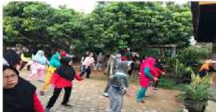
Gambar 2.20 Senam Rutin Lansia

Mengikuti senam rutin lansia setiap hari selas sore.