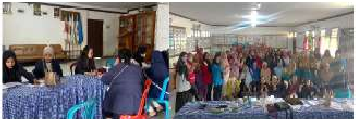
Gambar 2.15 Menghadiri Posyandu Lansia

Menghadiri Posyandu Lansia dan membantu proses posyandu di Balai Desa Wiyono.