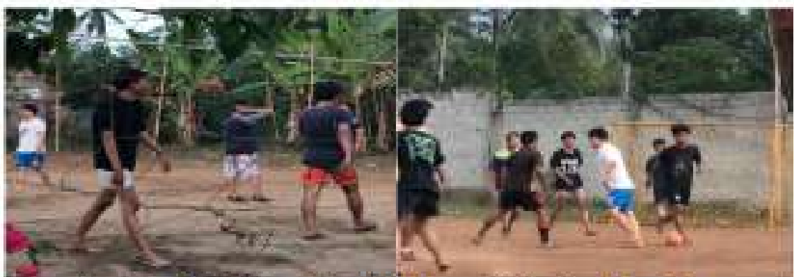
Gambar 2.16 Mengikuti Olahraga Voly dan Futsal

Mengikuti olahraga futsal dan bola volly bersama pemuda Desa Wiyono.