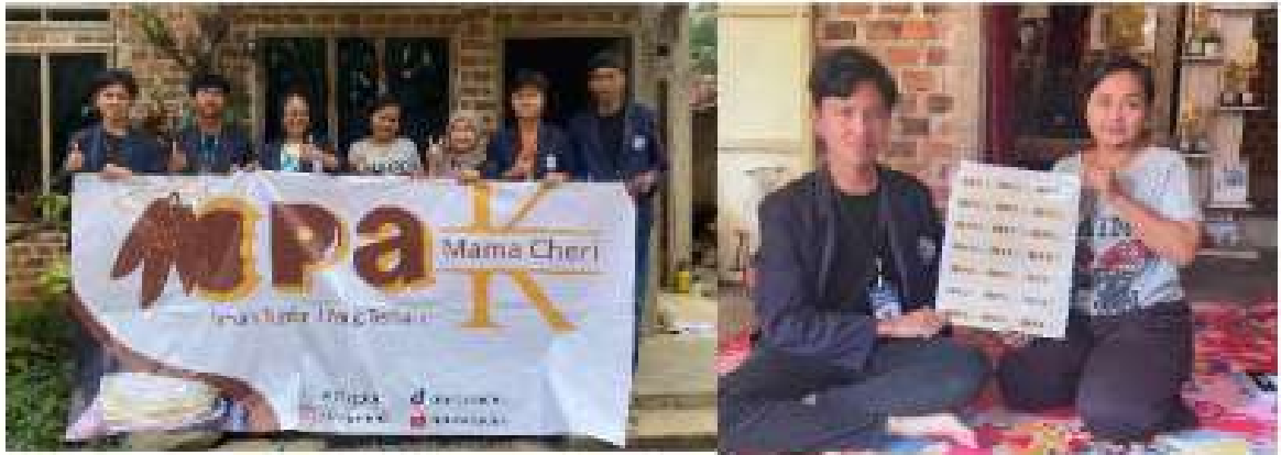
Gambar 2.12 Penyerahan Banner dan Stiker Logo UMKM