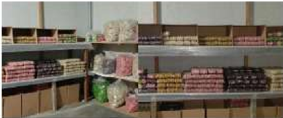
Gambar 2.10 Kunjungan ke UMKM Rengginang

Berkunjung ke UMKM Rengginang Cumbuy di Dusun Way Hui