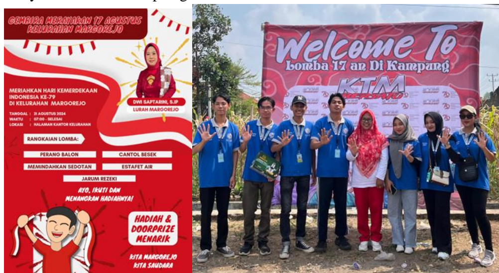
Gambar 2.7 Poster Lomba dan Kepanitiaan

Sementara itu, kantor kelurahan menyelenggarakan lomba dalam rangka merayakan kemerdekaan Republik Indonesia dan memerlukan desain poster yang informatif dan menarik untuk mengundang partisipasi masyarakat serta menambah semangat perayaan. Panitia lomba Agustusan di tingkat RT dan kantor kelurahan juga memerlukan berbagai desain promosi untuk memastikan acara terlaksana dengan baik dan meriah. Semua desain ini diharapkan dapat menyampaikan informasi dengan jelas, memperkuat branding, dan membangun keterlibatan masyarakat dalam setiap kegiatan.