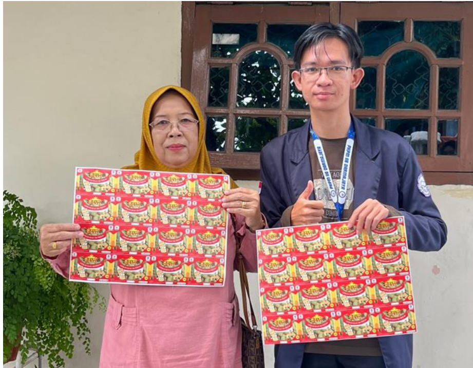
Gambar 2.6 Penyerahan Sticker Stik Keju Dapur Ibu