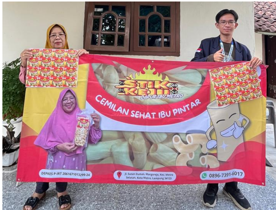
Gambar 2.5 Penyerahan Banner Stik Keju Dapur Ibu

Sedangkan untuk stiker kemasan owner UMKM Stik keju menginginkan redesain stiker kemasan yang baru. Filosofi elemen logo dan warna pada stiker yaitu pada logo terdapat siger dan tapis Lampung yang menjadi identitas logo atau produk ini berasal dari Provinsi Lampung, dan untuk warna pada banner yaitu warna kuning yang diambil dari warna siger Lampung, dan warna merah diambil dari corak tapis Lampung