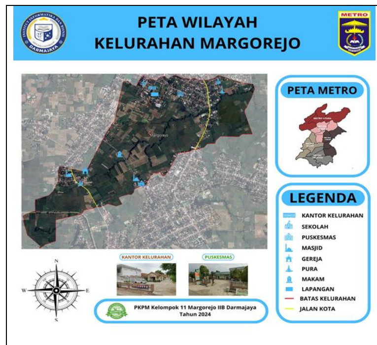
Gambar 2.8 Peta Kelurahan Margorejo

Dalam rangka pengabdian kepada masyarakat, peta kecamatan dibuat untuk memetakan wilayah secara detail, untuk memudahkan identifikasi infrastruktur, sumber daya lokal, dan kebutuhan masyarakat lokal, sehingga dapat mendukung perencanaan masyarakat yang lebih tepat sasaran dan meningkatkan kualitas pelayanan publik layanan di tingkat lokal. Serta pembuatan peta kelurahan ini juga membantu kelurahan untuk memperbarui peta lama yang sudah lama tidak di update.