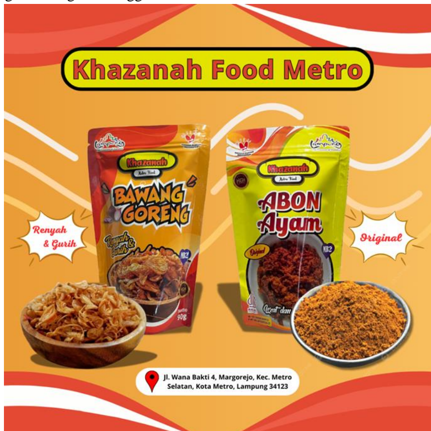
Gambar 2.2 Desain Stiker Khazanah Food Metro

Filosofi warna dan elemen dalam pembuatan stiker ini yaitu warna orange dan merah yang diambil dari ciri khas warna dari Khazanah Food Metro dan elemen seperti gelombang itu menggambarkan aroma kelezatan dari makanan.