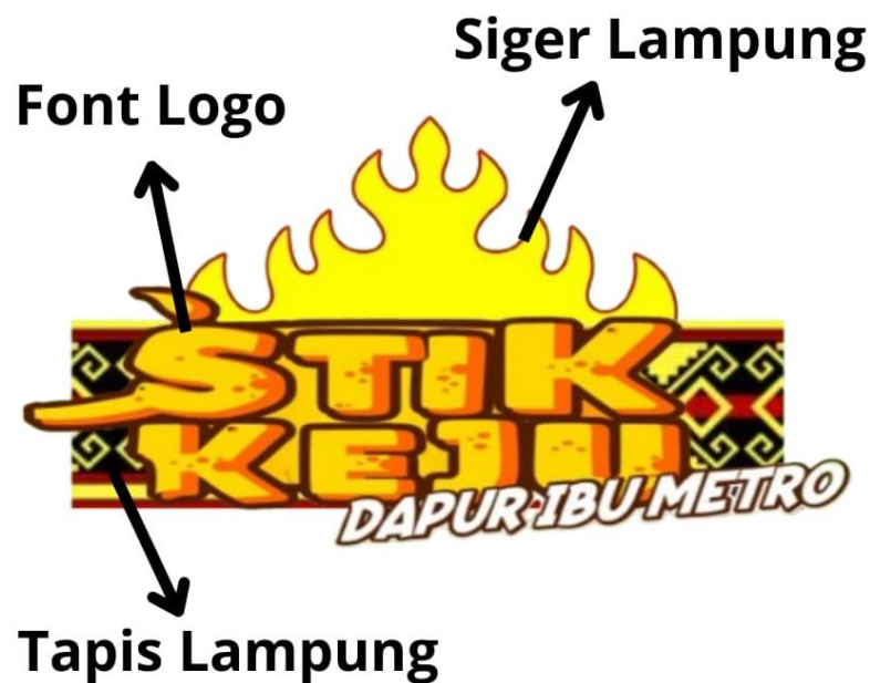
Gambar 2.4 Logo UMKM Stik Keju

Filosofi elemen logo dan warna pada banner yaitu pada logo terdapat siger dan tapis Lampung yang menjadi identitas logo atau produk ini berasal dari Provinsi Lampung, dan untuk warna pada banner yaitu warna kuning yang diambil dari warna siger Lampung, dan warna merah diambil dari corak tapis Lampung.