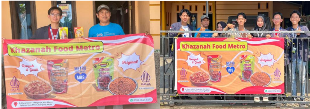
Gambar 2.1 Penyerahan Banner UMKM Khazanah Food Metro

Desain stiker mengusung konsep kreatif yang menggunakan warna dan elemen visual yang mudah dikenali untuk meningkatkan brand recall. Informasi yang tercetak pada stiker bisa mencakup nama produk, tagline, atau informasi singkat lainnya yang relevan, dengan mempertimbangkan format dan bahan stiker yang tahan lama serta kualitas cetak untuk hasil terbaik.