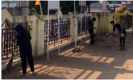
Gambar1. 11 Gotong royong membersihkan Kelurahan Purwosari