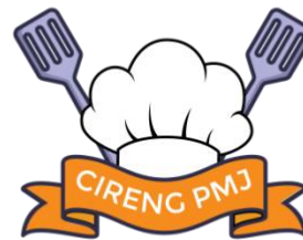
Gambar1. 4 Logo UMKM Cireng PMJ