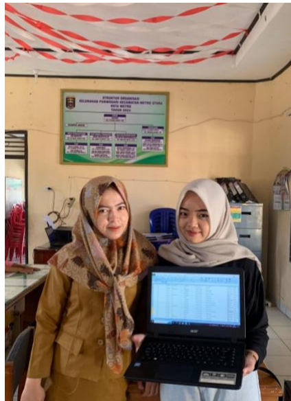
Gambar1. 10 Penginputan data penduduk di kelurahan purwosari.

Untuk membantu pengembangan promosi UMKM dapur umza dan seblak 3 tete menggunakan fitur artikel di website kelurahan.