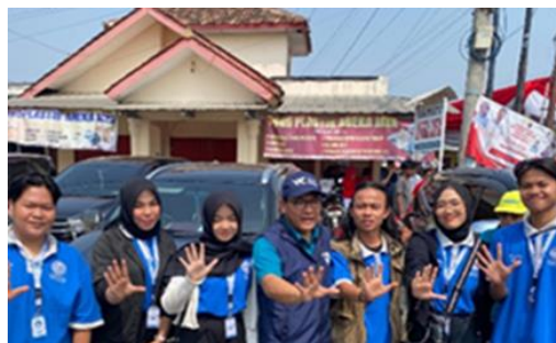
Gambar1. 15 Acara Jalan Sehat Purwosari dan Metro Sport Tourism