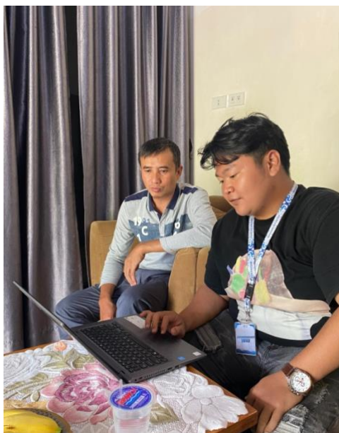
Gambar1. 6 penerapan aplikasi buku warung di UMKM dapur umza (Cireng PMJ)

Selanjutnya Tim membantu UMKM Anugrah Mandiri memperkenalkan serta menyusun laporan keuangan dengan pembukuan sederhana menggunakan excel.