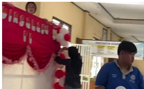
Gambar1. 14 Mendekorasi Kelurahan