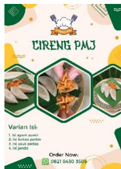
Gambar1. 3 Flyer UMKM Cireng PMJ