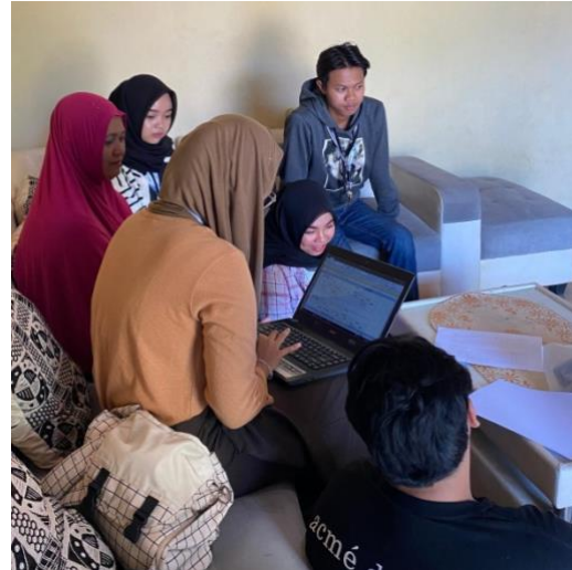
Gambar1. 5 Pembukuan sederhana menggunakan Excel

Selanjutnya Tim membantu UMKM Anugrah Mandiri memperkenalkan serta menyusun laporan keuangan dengan pembukuan sederhana menggunakan excel.