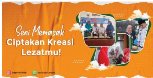
Gambar1. 7 Banner UMKM Dapur Oishi