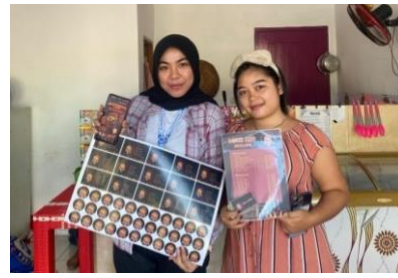
Gambar1. 6 Desain UMKM Seblak 3 TeteH