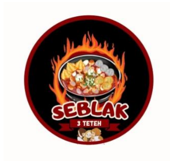
Gambar1. 5 Logo UMKM Seblak 3 TeteH