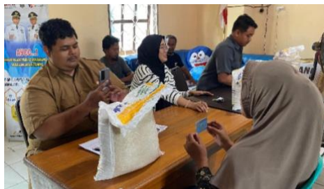
Gambar1. 13 Pembagian Beras CPP