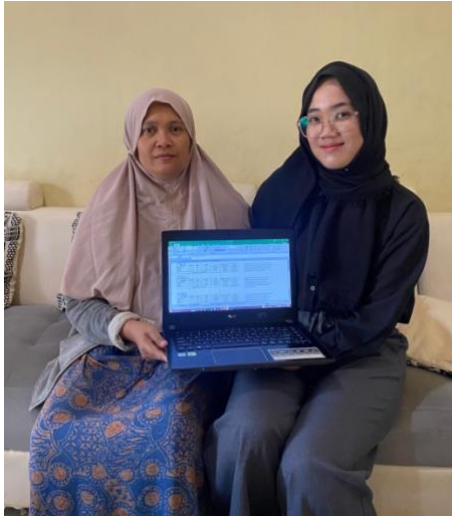
Gambar1. 4 Pelatihan perhitungan HPP produk

Setelah proses pengembangan media pemasaran dan penjualan online , selanjutnya dilakukan proses pendaftaran lokasi google maps usaha.