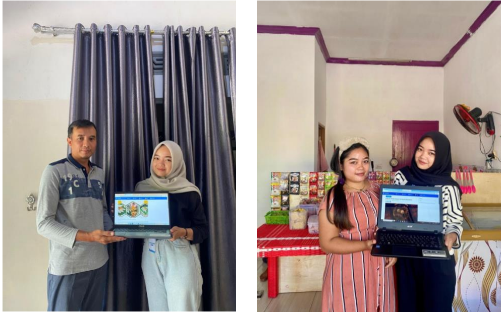
Gambar1. 9 Pembuatan serta pengenalan artikel dapur umza dan seblak 3tete di website Kelurahan.

Tim PKPM membantu UMKM Dapur Umza (Cireng PMJ) untuk mengetahui jumlah stok persediaan bahan baku, pengeluaran dan pemasukan dalam kegiatan produksi.