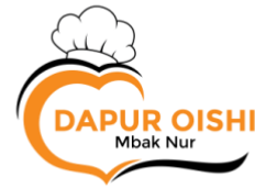
Gambar1. 8 Logo UMKM Dapur Oishi

Untuk mengatasi hal tersebut, tim PKPM melakukan re-desain pada UMKM Cireng PMJ, UMKM Dapur Oishi dan UMKM Seblak 3 TeteH guna memiliki identitas tersendiri, memperkuat kehadiran mereka di pasar, meningkatkan daya saing, dan menarik minat pelanggan baru.