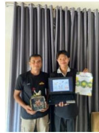
Gambar1. 2 Packaging UMKM Cireng PMJ