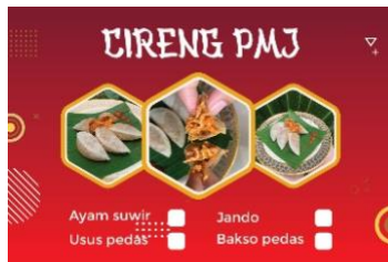
Gambar1. 1 stiker UMKM Cireng PMJ

Praktek Kerja Pengabdian Masyarakat (PKPM) yang dilakukan di Kelurahan Purwosari telah memberikan pengalaman berharga dalam masyarakat sehingga dapat mengidentifikasi dan mengatasi berbagai tantangan yang dihadapi oleh Usaha Mikro Kecil dan Menengah (UMKM) di Kelurahan Purwosari. Kelurahan ini memiliki banyak potensi terkhusus pada bidang pertanian dan Usaha Rumahhan. Namun, para pelaku UMKM di Kelurahan Purwosari memiliki keterbatasan dalam bidang teknologi. Sejalan dengan tema Kegiatan PKPM ini yang dirancang untuk memberikan solusi praktis dan pendampingan terhadap permasalahan tersebut, dengan fokus pada optimalisasi teknologi digital, pengelolaan keuangan, menyusun pembukuan sederhana dengan buku kas, dan pengembangan branding serta inovasi desain. Hasil tersebut ditunjukkan pada gambar berikut :