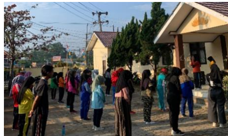
Gambar1. 12 Senam rutin bersama Lembaga Lanjut Usia Indonesia