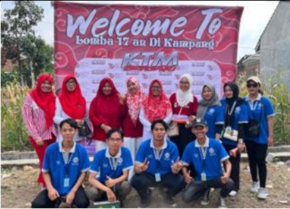
Panitia Jalan Sehat di RW 6