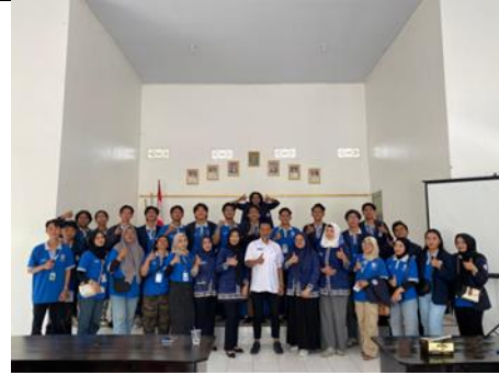
Pelepasan Mahasiswa PKPM di Kecamatan Metro Selatan