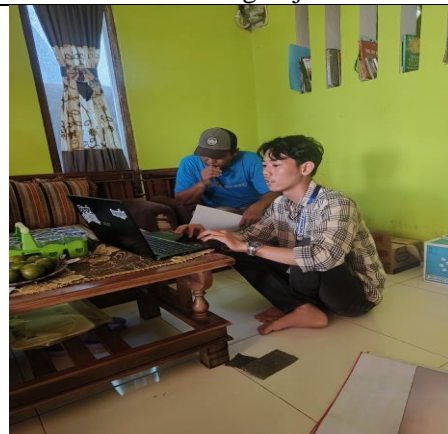
Penjelasan website UMKM Khazanah Food Metro