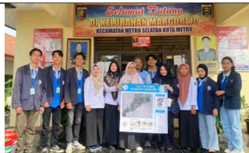
Penyerahan Peta Kelurahan Margorejo