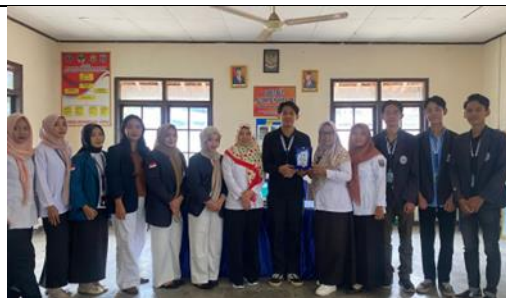
Penyerahan Plakat Kelurahan Margorejo