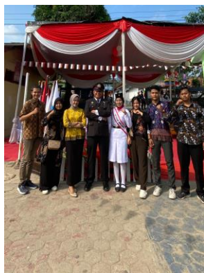
Upacara HUT RI ke-79