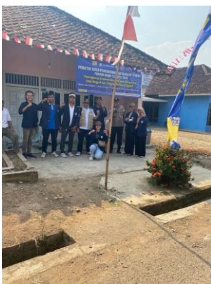
Panitia lomba kebersihan & 17an