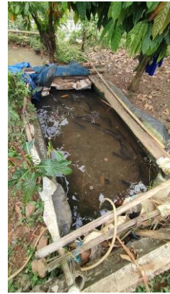
Berkunjung ke UMKM Ikan Lele & Ikan Patin