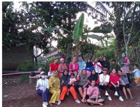
Senam rutin sore hari bersama ibu-ibu Dusun Taman Rejo