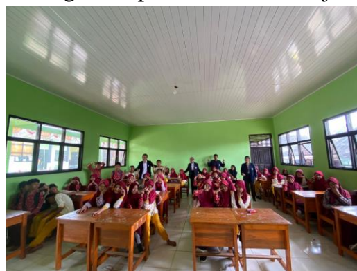
Sosialisasi Bullying di SD Negeri 26 Gedong Tataan