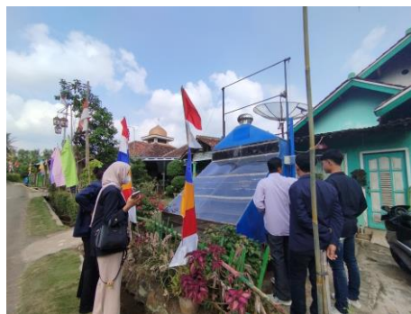
Kunjungan beberapa UMKM