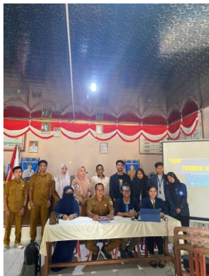
Kunuungan DPL & sosialisasi di Balai Desa