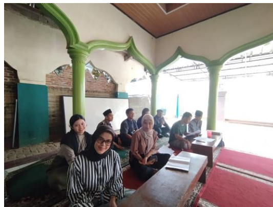
Menghadiri perlombaan di Masjid