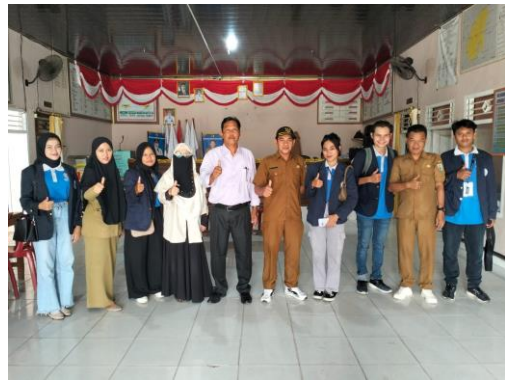
Pelepasan dan penyerahan mahasiswa/I PKPM