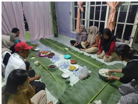
Makan bersama dengan aparatur desa & pemuda/i Dusun Taman Rejo