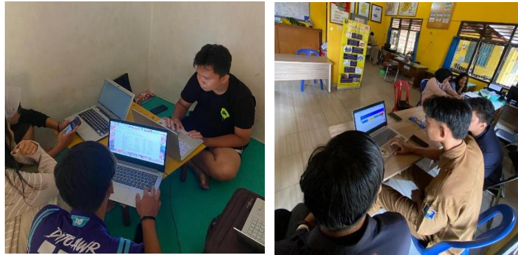
Gambar 2.4 Penginputan data BPS Kota Metro