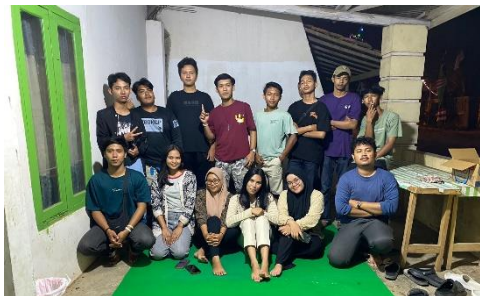
Gambar 2.7 Kegiatan Makan Bersama Masyarakat Sekitar

Kegiatan ini diadakan di salah satu rumah warga bersama pemuda pemudi RW 09 kelurahan Yosomulyo. Dengan diadakannya kegiatan ini bertujuan mempererat silaturahmi dengan masyarakat sekitar serta mengucapkan terimakasih atas penerimaan dan kerjasama kurang lebih sebulan selama PKPM berlangsung dengan harapan meninggalkan kesan baik dan positif.