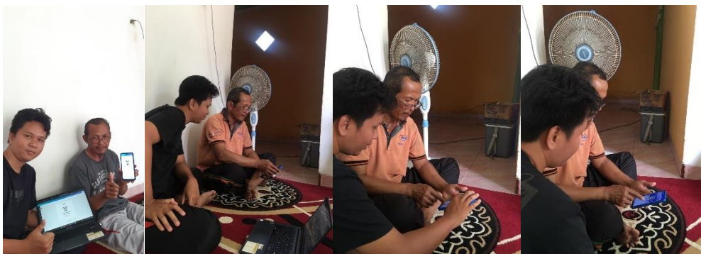
Gambar 2.1 Pelatihan Yang dilakukan kepada pelaku Usaha

Adapun hasil dari pelatihan branding produk sebagai berikut :