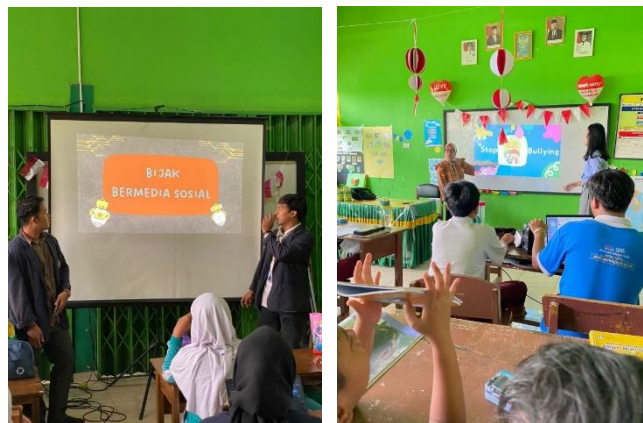
Gambar 2.5 Sosialisasi Bijak Media Sosial dan Bullying

Kegiatan ini merupakan kegiatan penting diberikan kepada siswa siswi sekolah dasar mengingat tujuan menanamkan nilai dan norma bertingkah laku yang baik dan benar harus ditanamkan sejak dini.