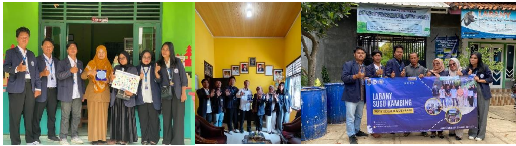
Gambar 2.8 Penyerahan Cinderamata