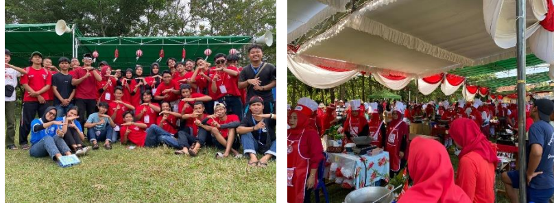
Gambar 2.6 Mengikuti Kepanitiaan HUT RI

Kegiatan ini merupakan kegiatan rutin yang dilakukan secara meriah setiap tahunnya oleh masyarakat Yosomulyo.