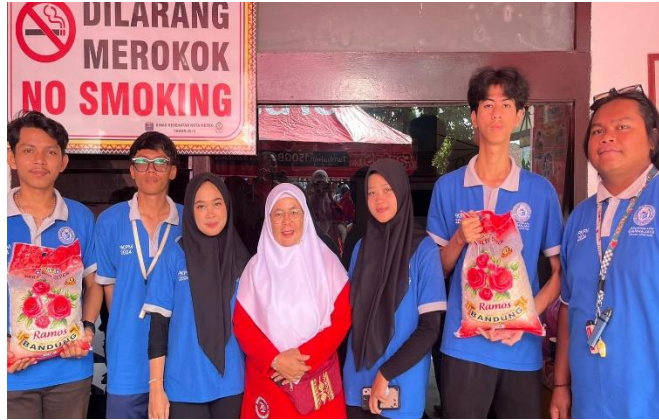
Perpisahan bersama Kelurahan Iringmulyo.