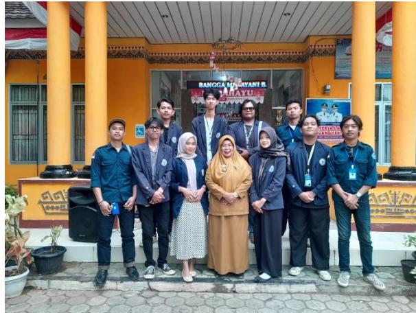
Mengunjungi CENTING IRENG ( Cegah Stunting Bareng-Bareng ) di Dapur Pengolahan Pmt Lokal bersama ibu Lurah dan ketua Pkk.