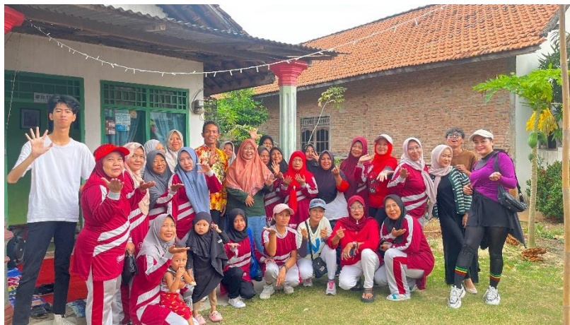
Menghadiri undangan bersama Bapak Ibu Camat dan Ibu Lurah di RW 14.