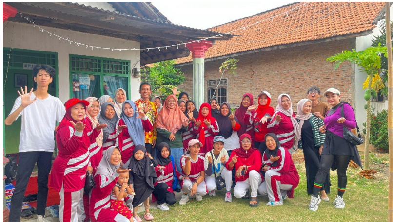
Menghadiri undangan bersama Bapak Ibu Camat dan Ibu Lurah di RW 14.