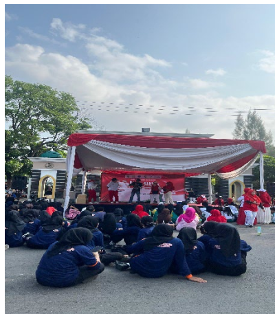
Apel rutin setiap hari senin di Kecamatan Metro Timur.