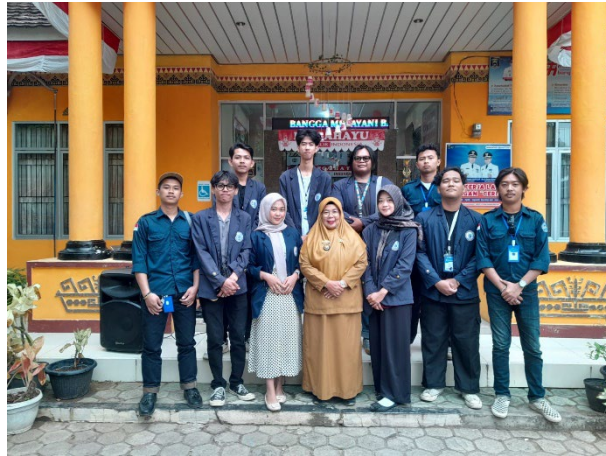
Mengunjungi CENTING IRENG ( Cegah Stunting Bareng-Bareng ) di Dapur Pengolahan Pmt Lokal bersama ibu Lurah dan ketua Pkk.