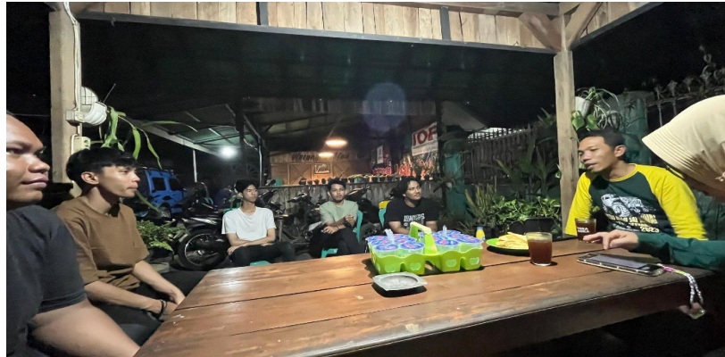
Kegiatan Survey UMKM kerak nasi.