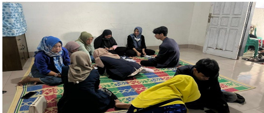
Gambar 2.6 Pelatihan kepada kaderisasi posyandu dalam menginput data STBM

Tanda nama yang dipasang agar suatu lokasi atau tempat bisa dikenali oleh orang-orang yang melewati tempat tersebut Program plangiasi yang dilakukan oleh kelompok PKPM IIB Darmajaya dilaksanakan di kelurahan Iringmulyo Kecamatan Metro Timur.