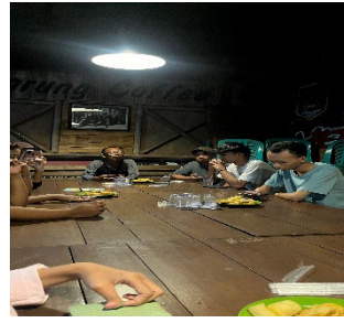
Gambar 2.3 Persiapan Lomba HUT-RI