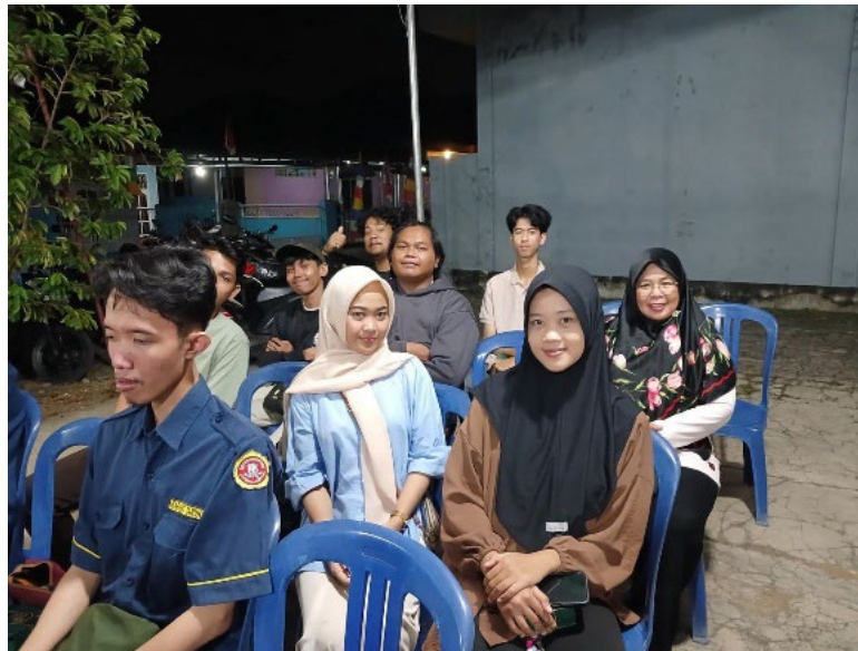
Gambar 2.8 Kumpul bersama dengan aparat desa dan karang taruna

Silaturahmi perangkat desa sangat penting karena perangkat desa merupakan ujung tombak pemerintah dalam memberikan pelayanan kepada masyarakat. Melalui silaturahmi, aparatur desa dan karang taruna dapat mempererat hubungan dengan masyarakat dan saling bertukar informasi mengenai berbagai hal yang berkaitan dengan kepentingan desa.