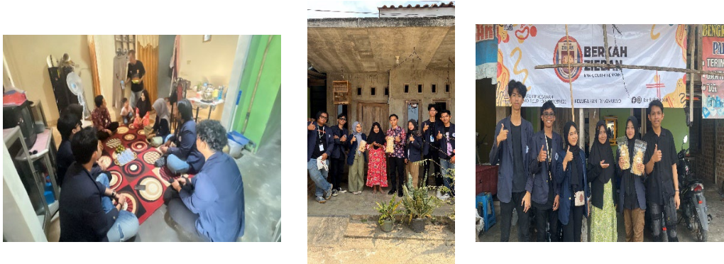
Gambar 2.1 Survei dan Wawancara kebutuhan UMKM

Kunjungan ke UMKM Berkah Zieban untuk melakukan pelaksanaan progja PKPM ini. Yang dimana pada saat itu melakukan kunjungan dan silaturahmi dengan pemilik UMKM serta berbincang mengenai permasalahan-permasalahan yang terjadi. Sehingga hasil dari perbincangan tersebut dapat menemukan titik terang mengenai program kerja yang akan dilaksanakan agar dapat membantu dari segala permasalahan.