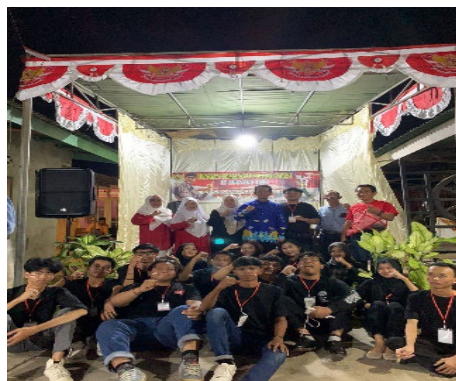
Gambar 2.4 Persiapan dan Pelaksanaan HUT RI ke 79