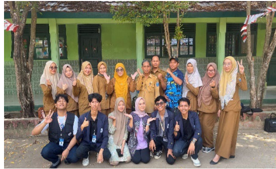
Gambar 2.5 Sosialisasi di SDN 3 Metro Timur tentang “pentingnya menabung di usia dini”