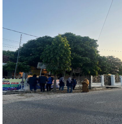
Gambar 2.7 pemasangan plang di balai desa