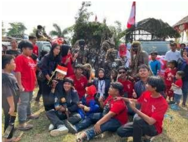
Instagram dan Tiktok Kelompok 09