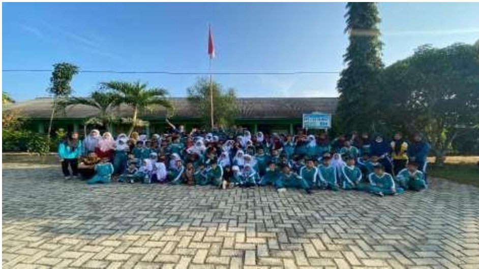
Kegiatan Lomba Agustusan dan Karnaval Budaya