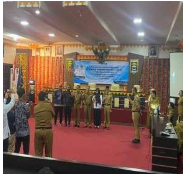
Silaturahmi dengan Ketua RW 09 dan RT 25 Kelurahan Yosomulyo