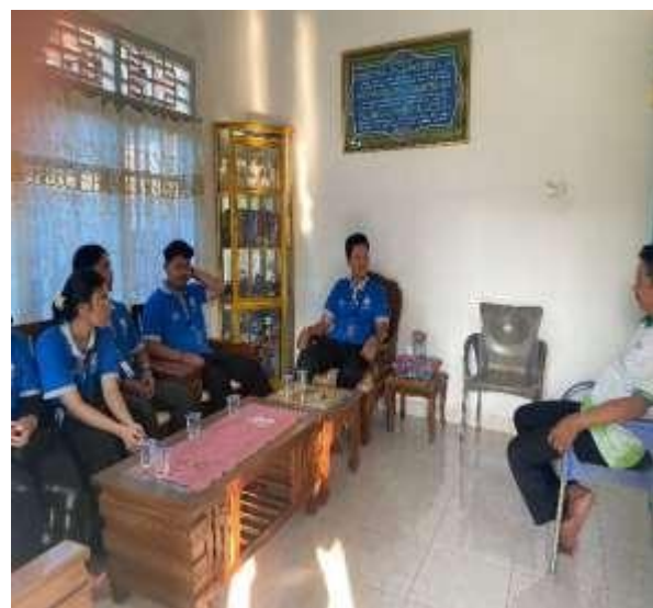
Kunjungan UMKM Kampung Lebah Dan Labany Susu Kambing