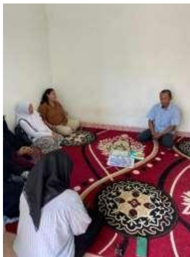
Sosialisasi Bijak Bermedia dan Bullying di SDN 08 Metro Pusat