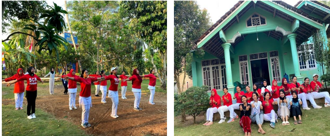
Gambar 2.9 Senam Bersama Ibu-Ibu Desa Pujorahayu