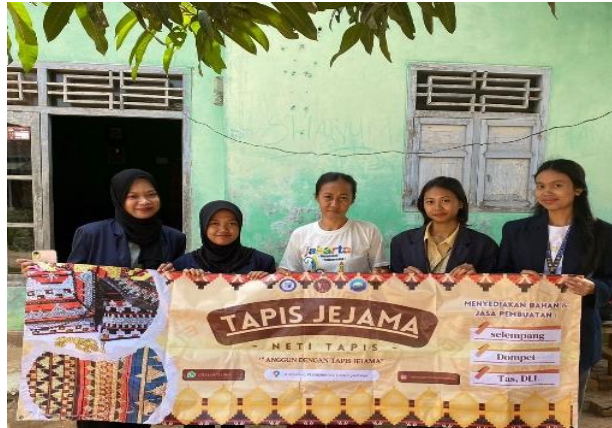
Gambar 2.4 Sosialisasi Menabung Sejak Usia Dini

PKPM Darmajaya melakukan pemberian banner kepada UMKM Tapis Jejama