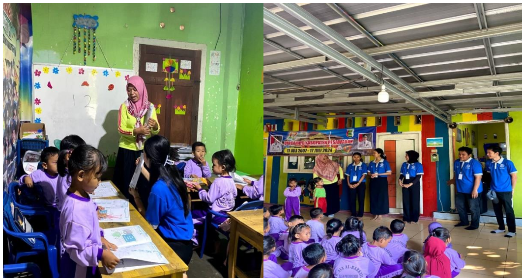
Gambar 2.5 Kunjungan ke TK ASA AL-BARKATI