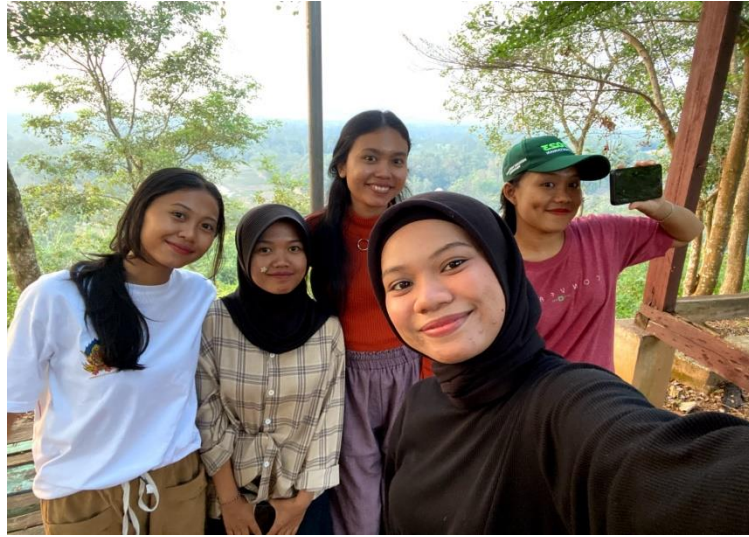
Gambar 2.8 Kunjungan ke Wisata TABURA Desa Pujorahayu