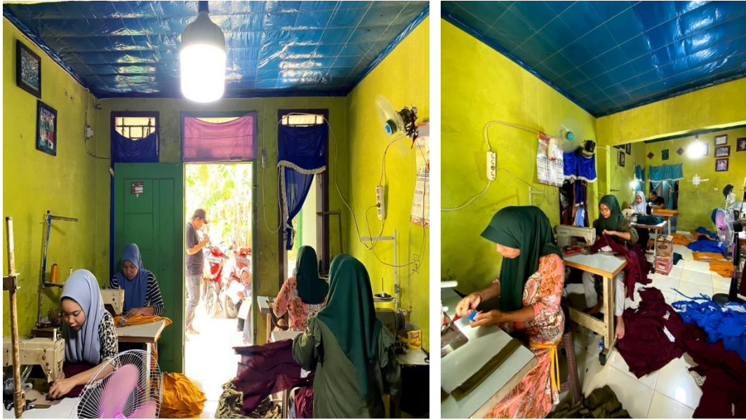
Gambar 2.6 Kunjungan ke UMKM Konveksi Suci