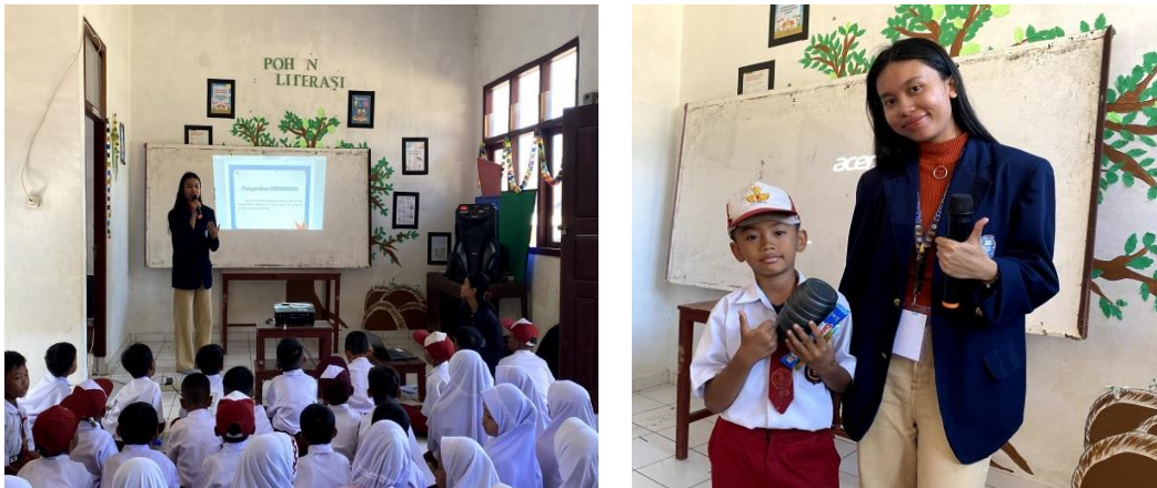
Gambar 2.3 Sosialisasi Menabung Sejak Usia Dini

membentuk kebiasaan menabung yang baik sejak awal, mengajarkan pentingnya mengelola uang untuk persiapan masa depan.