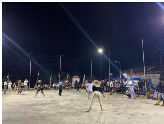
Mengikuti perlombaan & kepantitian Gobak Sodor