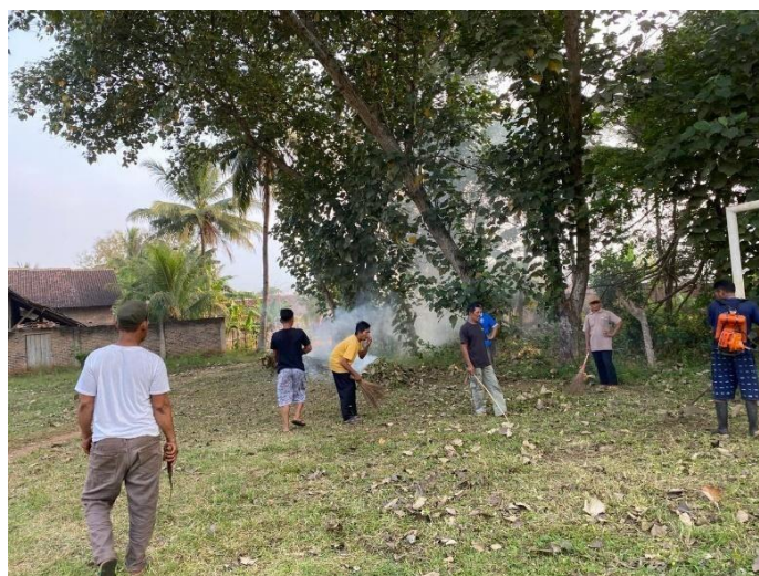
Membantu membersihkan lapangan persiapan 17 Agustus