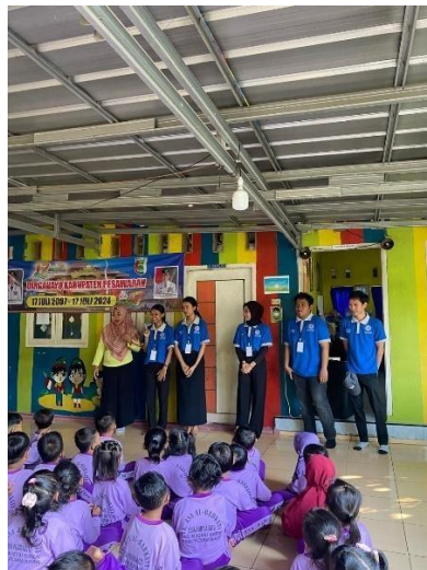
Kunjungan ke TK ASA AL-BARKATI