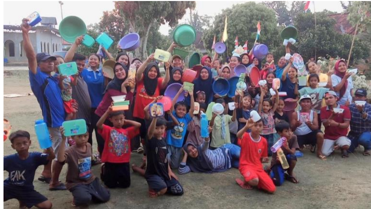
Mengikuti perlombaan hari kemerdekaan bersama masyarakat desa pujorahayu