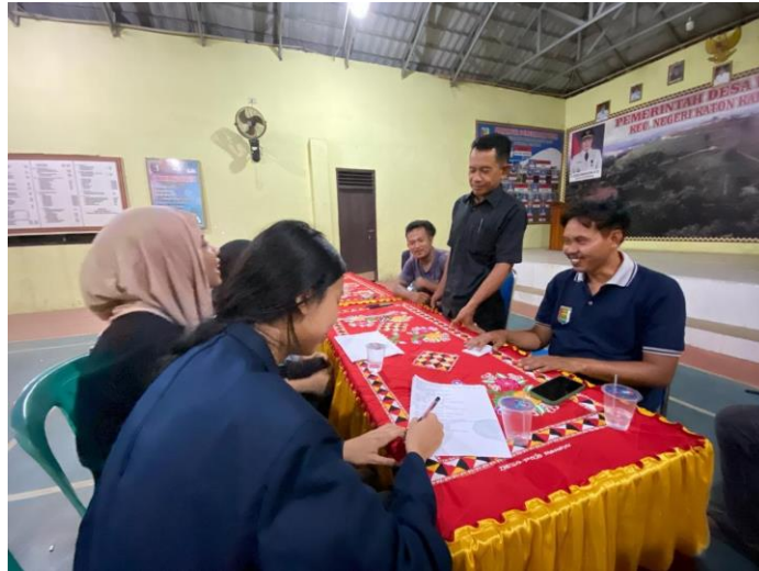
Rapat bersama aparat desa & karang taruna untuk persiapan malam puncak