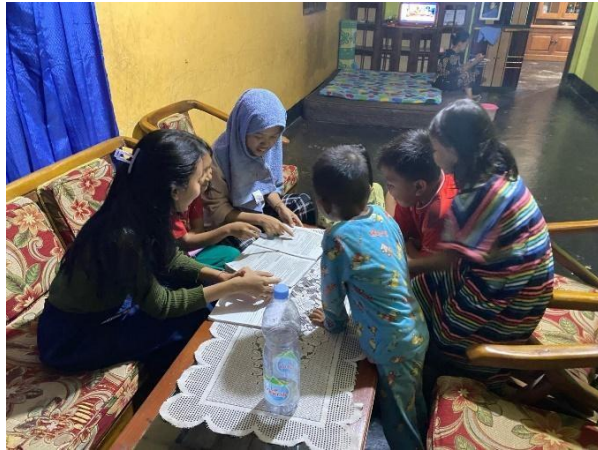
Rumah Belajar (membantu anak-anak SD mengerjakan PR)