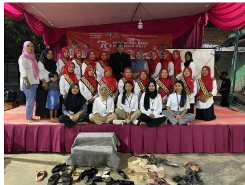
Berpartisipasi dalam malam puncak HUT RI ke-79