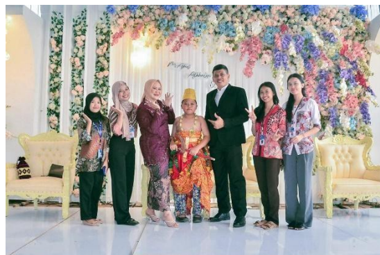
Membantu & Menghadiri acara khitanan anak kepala desa pujorahayu