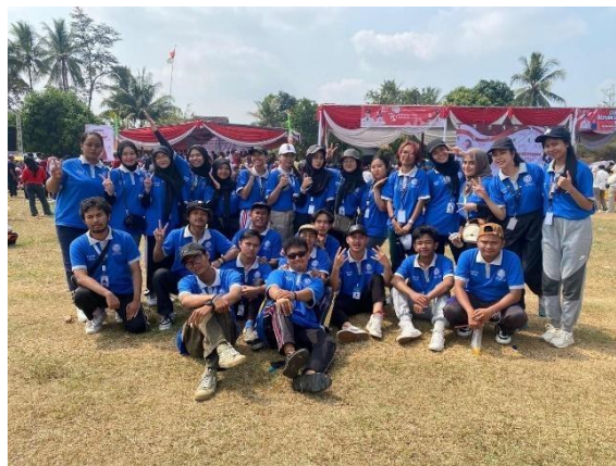
Mengikuti jalan sehat di desa pejambon