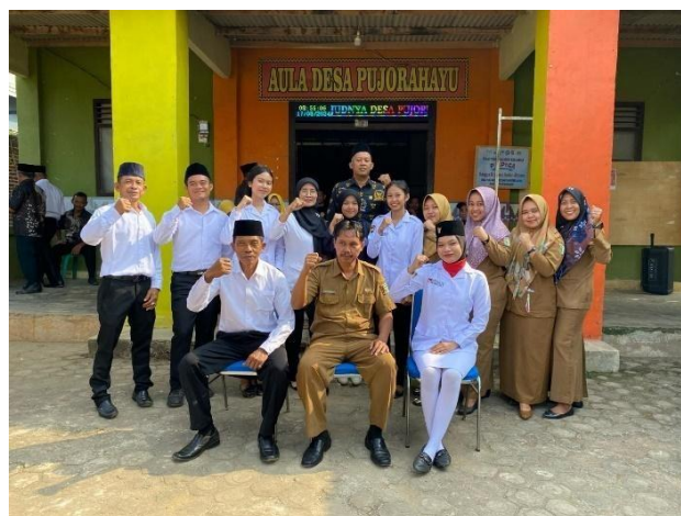
Mengikuti upacara hari kemerdekaan indonesia ke-79 di desa pujorahayu