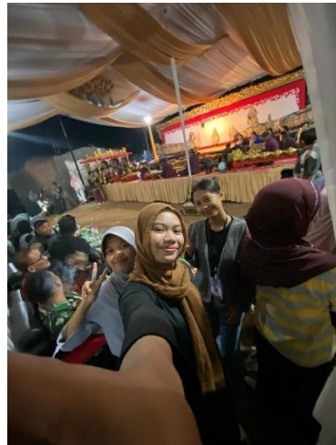
Menonton pagelaran wayang kulit "Karya Budaya"