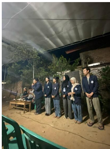
Perkenalan kelompok 34 dengan aparaturnya desa pujorahayu