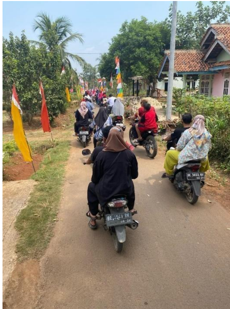
Mengikuti acara sepeda santai dalam rangka hari kemerdekaan