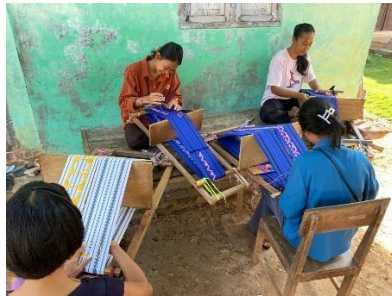
Mengunjungi UMKM Tapis Jejama