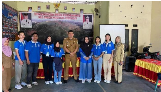
Pelepasan mahasiswa PKPM di kampus IIB Darmajaya & Penyambutan mahasiswa PKPM di Desa Pujorahayu