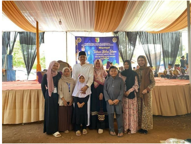
Menghadiri acara tahun baru islam desa pujorahayu