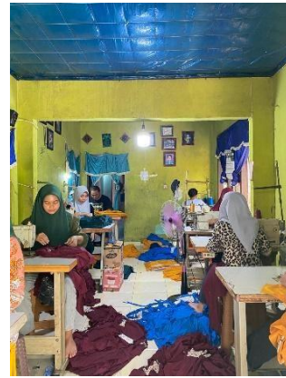
Mengunjungi UMKM Konveksi Suci