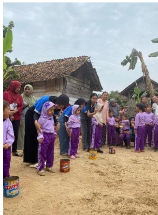
Membantu perlombaan hari kemerdekaan di TK ASA AL-BARKATI