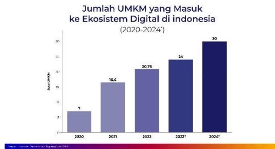
Gambar 1.1 Jumlah UMKM 2020-2024