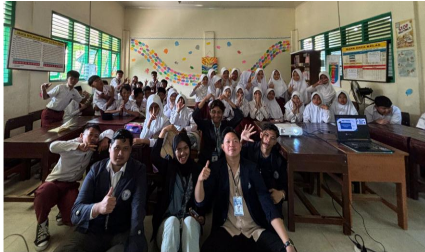
Gambar 6 Sosiolisasi di SDN 1 Metro Barat

sekitar 40 siswa kelas 6 pada tanggal 13 Agustus 2024. Tujuan utama program adalah meningkatkan kesadaran dan memberikan pengetahuan tentang pencegahan bullying.