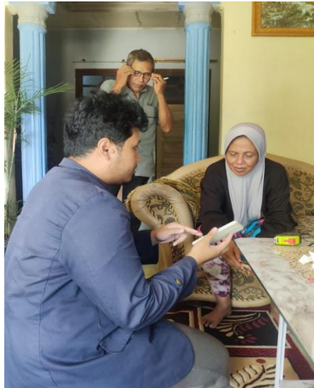
Gambar 3 Pelatihan penggunaan Linktr.ee

Dengan melatih pemilik cara menggunakan Linktr.ee Pemilik dapat dengan mudah mengedit tauatan luar maupun kontak yang dimiliki oleh Kemplang Cap Siger