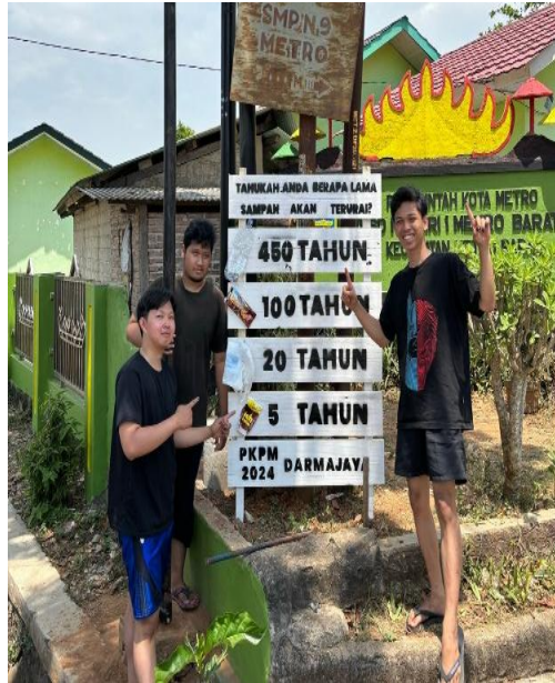
Gambar 7 Pembuatan Plang Edukasi Sampah