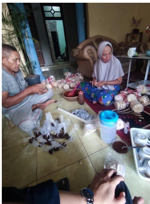
Gambar 5 Survei UMKM Kemplang Cap Siger

Survei UMKM Kemplang Cap Siger di Kelurahan Mulyosari bertujuan untuk mengidentifikasi potensi dan tantangan yang dihadapi oleh pelaku usaha lokal. Hasil survei ini akan memberikan wawasan tentang kebutuhan spesifik dan area yang memerlukan dukungan, serta membantu dalam perencanaan strategi pengembangan yang lebih efektif. Dengan data yang diperoleh, diharapkan dapat meningkatkan keberlanjutan dan pertumbuhan UMKM di daerah tersebut.