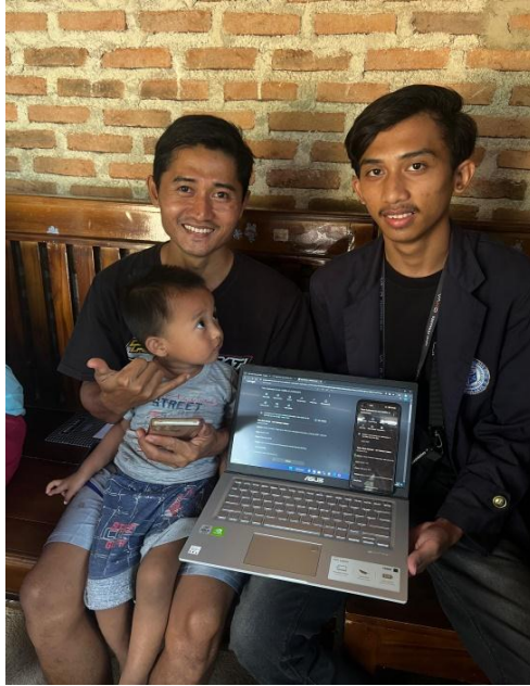
Gambar 2.5 Penempatan Lokasi Usaha Pada GoogleMap