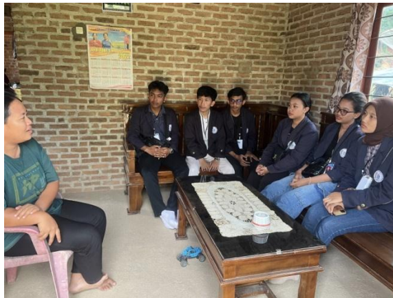
Gambar 2.1 Survei UMKM Batu Bata

Kegiatan survei dan wawancara kepada usaha Tobong Batu Bata ini memiliki tujuan diantaranya mengidentifikasi dan mengenali usaha untuk memperoleh informasi yang diperlukan mengenai langkah apa saja yang mungkin dibutuhkan untuk pengembangan usaha.