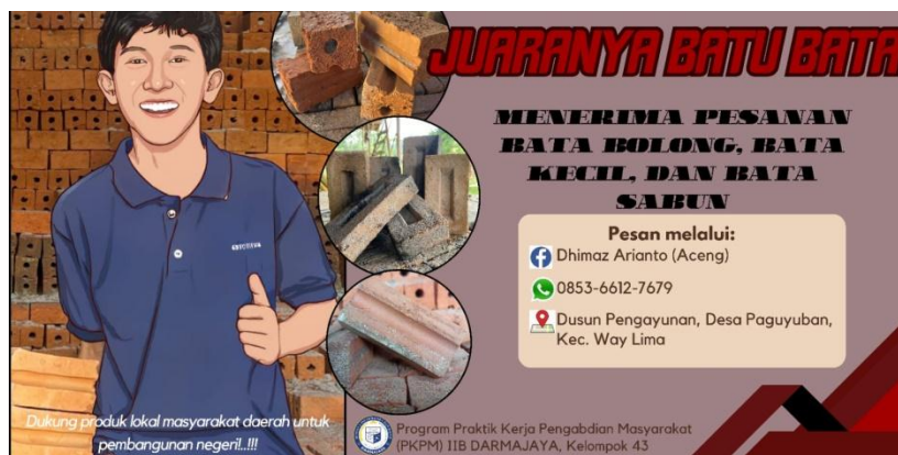
Gambar 2.3 Desain Media Cetak Pemasaran Banner/Brosur