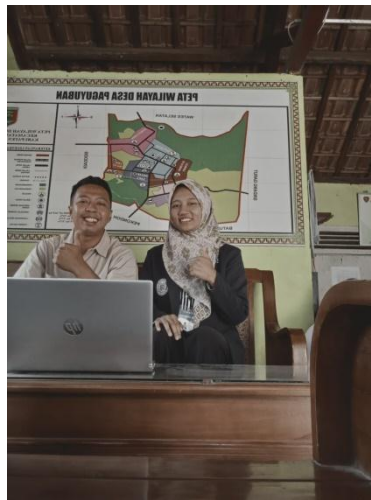
Gambar 2.7 Mengelola Web Desa

Diskusi bersama perangkat desa mengenai pengelolaan web Desa Paguyuban dan bekerjasama untuk menemukan solusi dari masalah pendataan kependudukan serta pembagian tugas sehingga pengelolaan dapat menjadi efektif. Partisipasi yang dilakukan adalah membantu kegiatan pendataan dan meng- input data ke dalam web desa bersama perangkat desa guna mempermudah dan mengefisiensi data penduduk agar dapat diakses secara umum baik oleh perangkat desa atau seluruh masyarakat Desa Paguyuban.