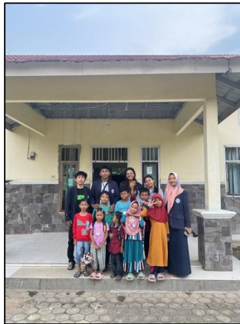
Gambar 2.9 Mengajar Bahasa Inggris

Tujuan dari kegiatan ini adalah untuk mensosialisasikan pengetahuan dasar mengenai salah satu bahasa global yakni bahasa Inggris sebagai salah satu uji kompetensi di tingkat sekolah.