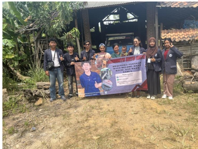
Gambar 2.6 Penyerahan Hasil Program Kerja

Tujuan dari kegiatan ini adalah untuk menyerahkan kepada pemilik usaha hasil dari kegiatan membantu mempersiapkan dan mengelola digitalisasi usaha diantaranya akun marketplace sosial media FaceBook, desain logo usaha, media cetak promosi (brosur dan banner ) dan menampilkan lokasi usaha yang dapat diakses melalui perangkat digital handphone dan komputer.