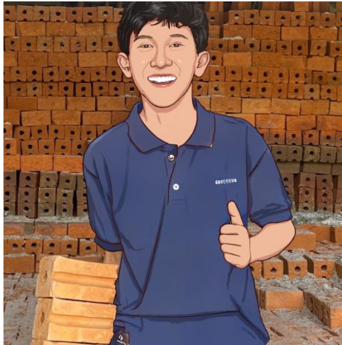
Gambar 2.2 Desain Logo Usaha