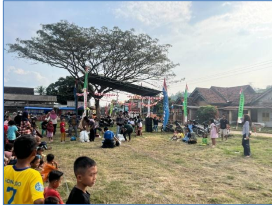
Gambar 2.10 Pemeriahan HUT RI Ke-7