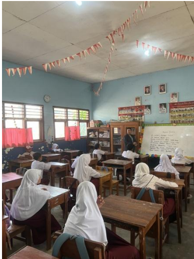
Gambar 2.8 Belajar Bersama Siswa/i SD