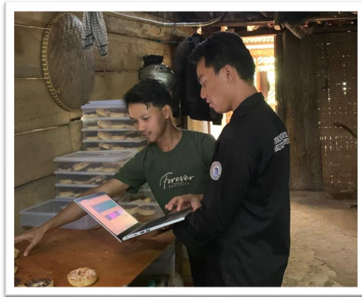
Gambar 2.2 Survei dan Observasi UMKM

2.3.3 Memaparkan dan Mendapatkan Izin Program Kerja: Paparan program kerja kepada pihak desa dan pengelola UMKM berjalan lancar. Persetujuan dan dukungan dari pihak terkait diperoleh, memastikan bahwa program yang dilaksanakan sesuai dengan kebutuhan dan harapan masyarakat desa.