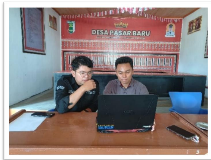
Gambar 2.1 Sosialisasi Website Desa (Sipdeskel) oleh Aparatur Desa

2.3.1 Sosialisasi Mengenai Website Desa (SIPDESKEL) oleh Pihak Desa kepada Mahasiswa Ilmu Komputer: Sosialisasi ini berhasil memberikan pemahaman mendalam kepada mahasiswa mengenai fungsi dan manfaat dari SIPDESKEL. Mahasiswa memperoleh pengetahuan mengenai berbagai fitur yang ada di dalam website, termasuk pentingnya pengelolaan data kependudukan dan UMKM secara digital. Dokumentasi untuk kegiatan ini dapat dilihat pada Gambar 2.1