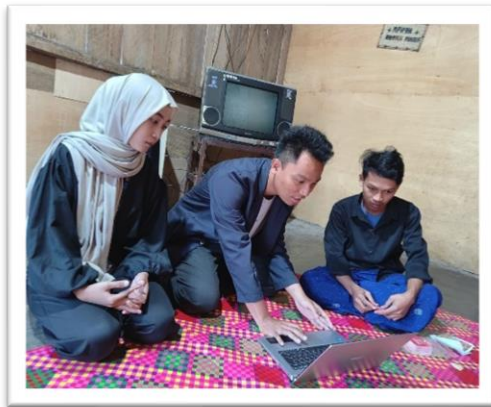
Gambar 2.5 Sosialisasi Fitur Metamart kepada UMKM

2.3.5 Sosialisasi Fitur Metamart kepada UMKM Donat Aqila: Sosialisasi fitur Metamart kepada UMKM Donat Aqila berhasil meningkatkan pemahaman mengenai manfaat platform ini. UMKM Donat Aqila menunjukkan minat yang tinggi dan siap untuk memanfaatkan Metamart guna meningkatkan visibilitas produk mereka.