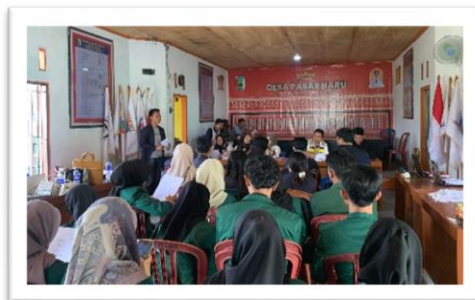
Gambar 2.3 Pemaparan dan Perizinan Program Kerja

2.3.3 Memaparkan dan Mendapatkan Izin Program Kerja: Paparan program kerja kepada pihak desa dan pengelola UMKM berjalan lancar. Persetujuan dan dukungan dari pihak terkait diperoleh, memastikan bahwa program yang dilaksanakan sesuai dengan kebutuhan dan harapan masyarakat desa.