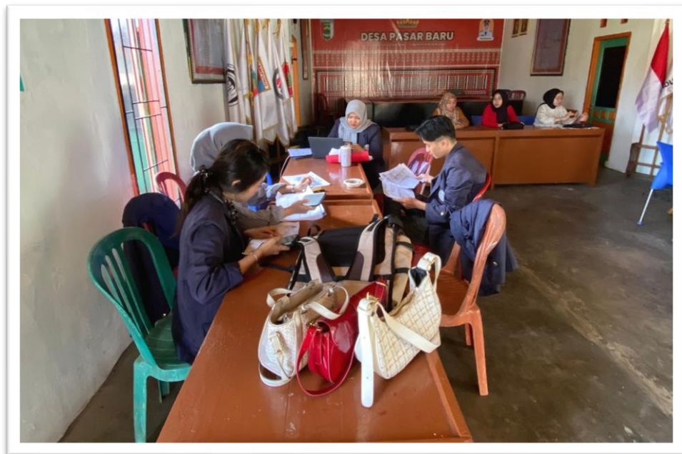
Gambar 2.4 Input Data Keluarga / Kependudukan

SIPDESKEL: Data kependudukan berhasil diinput ke dalam website SIPDESKEL dengan akurat dan lengkap. Penginputan ini menciptakan dasar yang solid untuk pengembangan fitur-fitur lain dalam sistem, termasuk pengelolaan data UMKM.