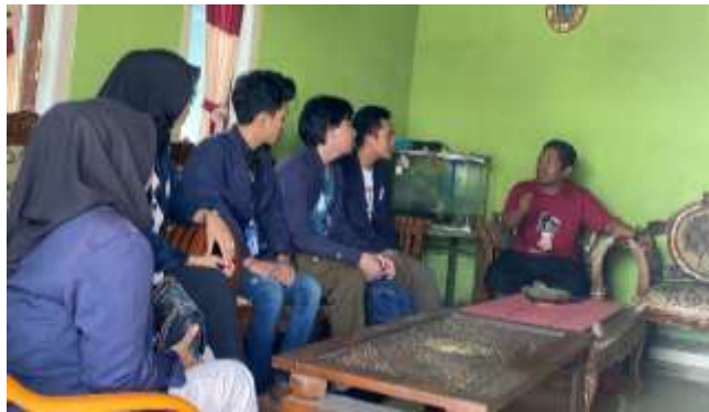
Gambar 2.2 Wawancara UMKM

Langkah awal yang harus dilakukan untuk pembuatan Google Profile Business adalah wawancara pelaku usaha UMKM terkait untuk mendapatkan data-data yang dibutuhkan, seperti contohnya nama pemilik, nomor hp, alamat usaha, jam buka, dan lain-lain.