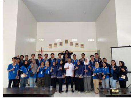
Pelepasan Mahasiswa PKPM di Kecamatan Metro Selatan