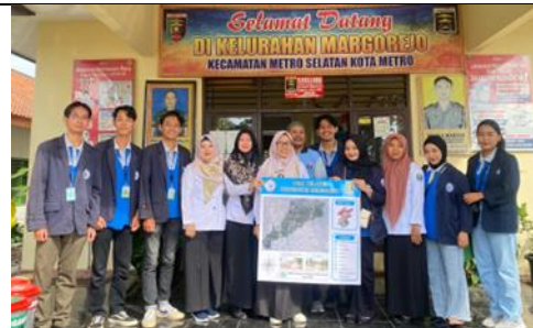
Penyerahan Peta Kelurahan Margorejo