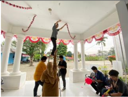
Dekorasi Kantor Keamatan Metro Selatan