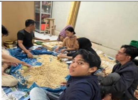
Kunjungan UMKM Tempe Lekman