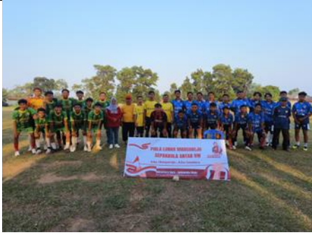
Perlombaan Bola Antar RW