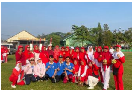
Senam Rutin di Kelurahan Sumbersari Bantul