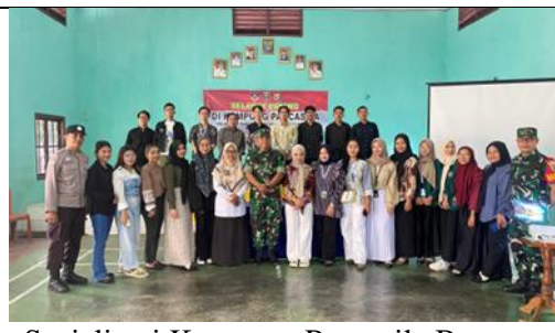
Sosialisasi Kampung Pancasila Bersama Bhabinkamtibmas dan Bhabinsa di Kelurahan Margorejo