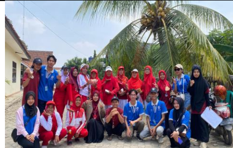
Panitia 17 Agustus Di Kelurahan Margorejo