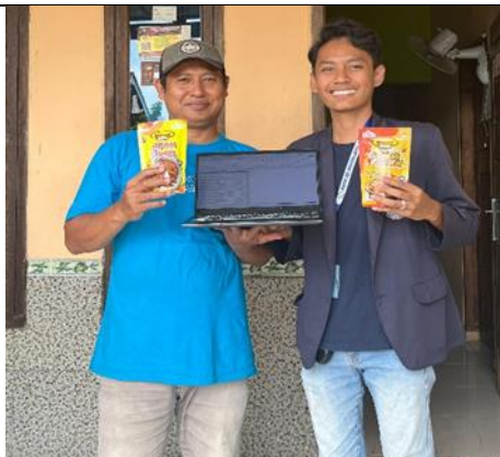
Penyerahan Laporan Keuangan UMKM Khazanah Food Metro