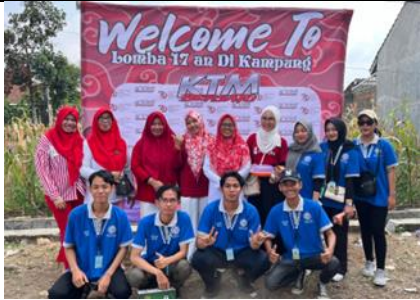
Panitia Jalan Sehat di RW 6