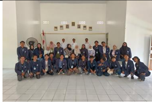
Pertemuan Dengan Kecamatan Metro