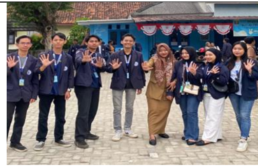
Apel Pagi Di Kecamatan Metro Selatan