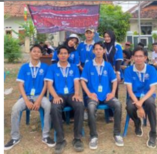
Panitia Lomba 17 Agustus di Rw 6