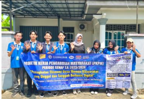
Penyerahan Peserta PKPM Oleh DPL