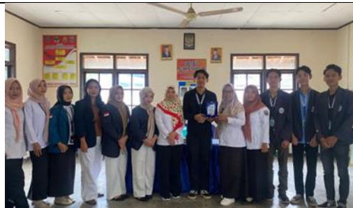
Penyerahan Plakat Kelurahan Margorejo