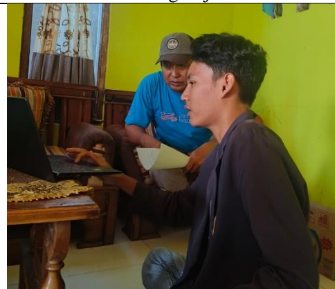
Pelatihan Laporan Keuangan Sederhana UMKM Khazanah Food Metro