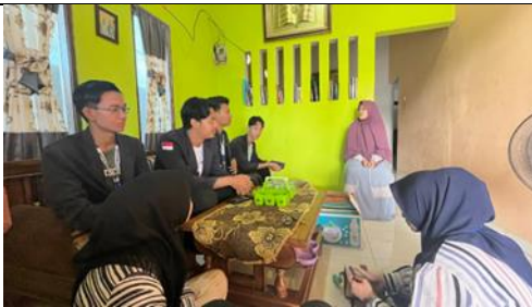
Kunjungan UMKM Khazanah Food Metro