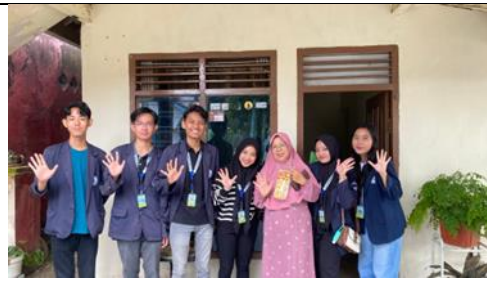
Kunjungan UMKM Stik Keju Dapur Ibu