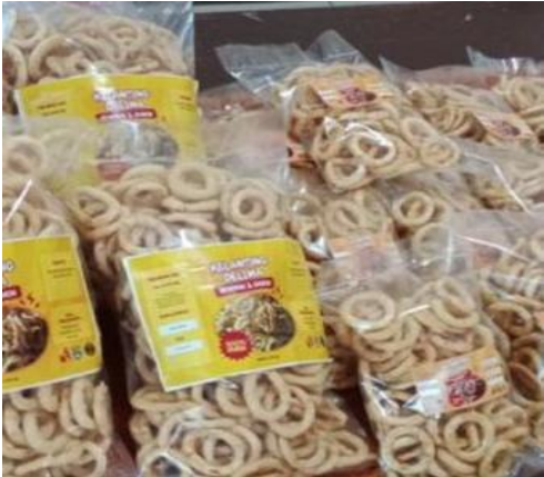
Gamabar 2.7 Pengaplikasian Kemasan