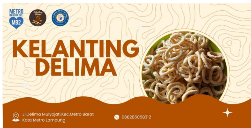
Gambar 2.5 Banner Untuk Pemasaran