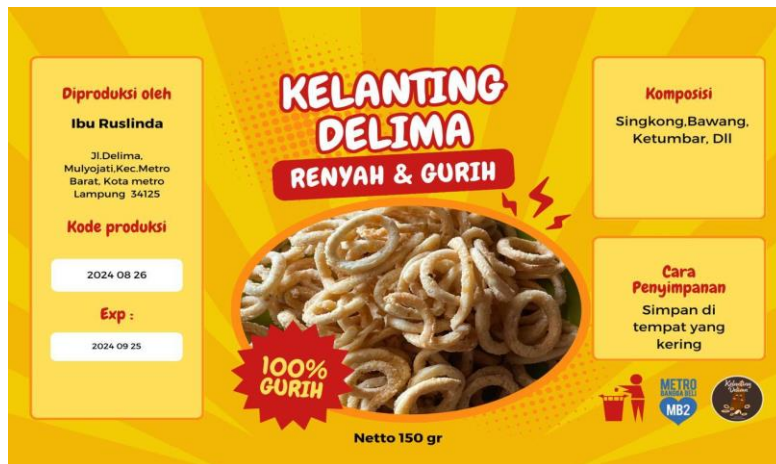
Gambar 2.4 Label untuk Kemasan