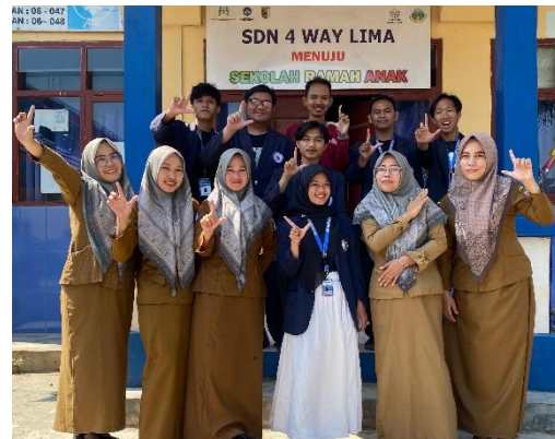
Foto Bersama Aparatur dan dan Guru-guru Sekolah SDN 04 Way Lima Desa Paguyuban