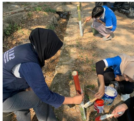
Kegiatan Gotong Royong Bersama warga Desa Paguyuban