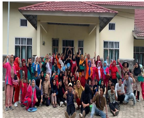
Kegiatan Senam Rutin Bersama Ibu-ibu di Desa Paguyuban