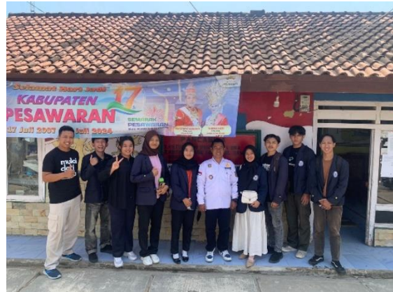
Pelepasan Mahasiswa PKPM oleh Dosen Pembimbing Lapangan Terhadap Kepala Desa