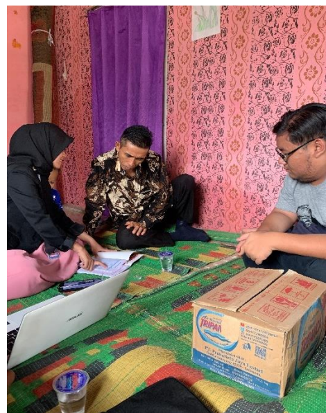
Proses Pembuatan Batu Bata dan Pelatihan Pencatatan Keuangan Sederhana pada UMKM Batu Bata Pakturiman