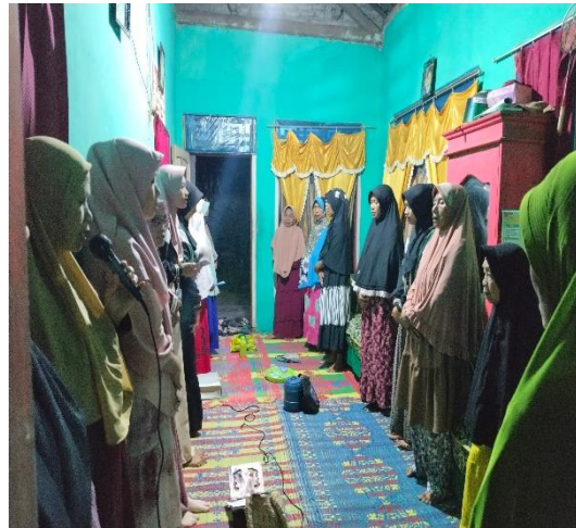
Kegiatan Pengaajian Rutin Bersama Ibu-Ibu di Desa Paguyuban