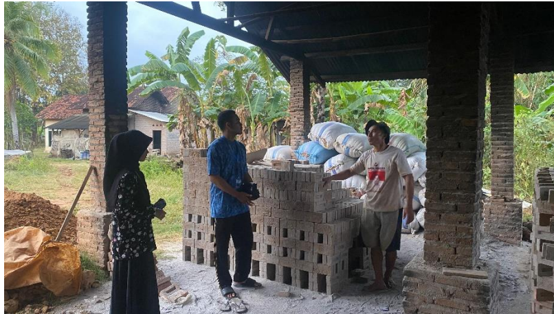
Survey UMKM Batu Bata di Dusun Sidomulyo Desa Paguyuban