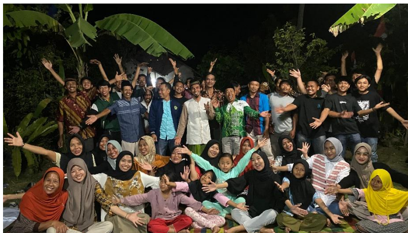
Acara Perpisahan Bersama Kepala dan Aparatur Desa serta Warga setempat