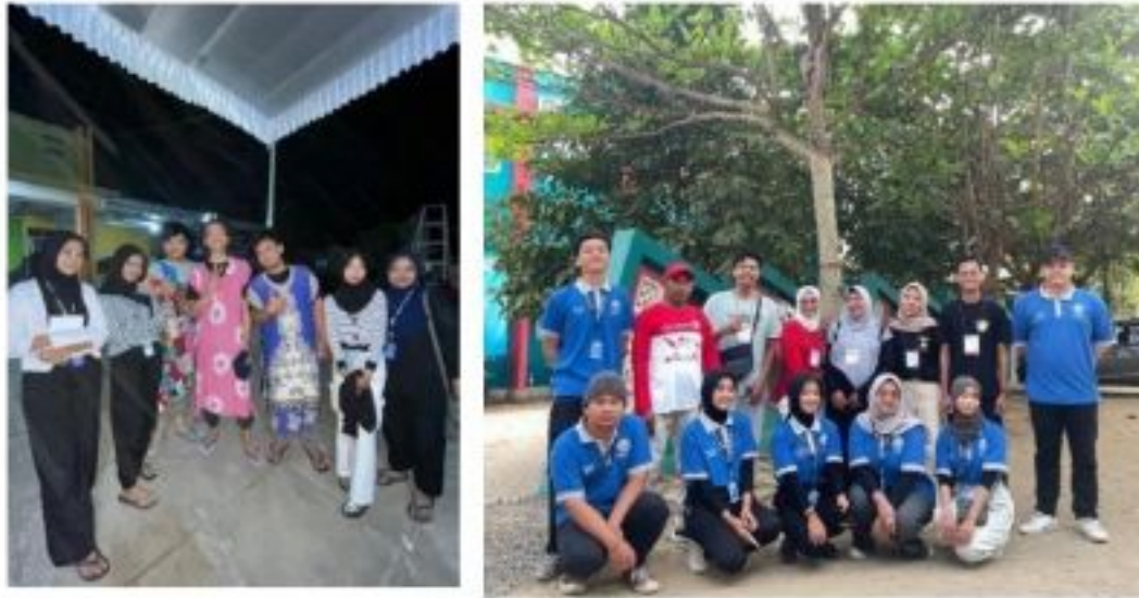
Gambar 2.6 Kegiatan selama perayaan HUT RI ke 79 di Kelurahan Tejosari