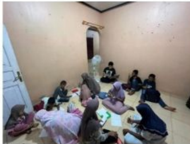
Gambar 2.7 Rumah Belajar

Rumah belajar merupakan kegiatan yang dilakukan untuk memberikan pengajaran kepada anak-anak di lingkungan sekitar. Dalam kegiatan ini, kami membantu anak-anak dalam penyelesaian tugas sekolah dan memberikan pengajaran yang mereka butuhkan seperti belajar membaca, berhitung dan lain sebagainya.