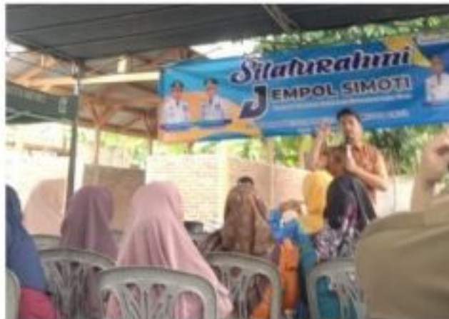
Gambar 2.5 Kegiatan Jempol Simoti

JEMPOL SIMOTI (Jemput Pelayanan Kolaborasi, Silaturahmi Metro Timur) merupakan kegiatan rutin yang ada di Kecamatan Metro Timur. Kegiatan JEMPOL SIMOTI ini meliputi berbagai pelayanan kepada masyarakat, antara lain Pemeriksaan Kesehatan Gratis, pelayanan pembuatan Nomor Induk Berusaha (NIB), PIRT, Sertifikasi Halal, serta Aktivasi Kependudukan Digital. Selain itu, tersedia juga Loker Pembayaran PBB yang bertujuan untuk mendukung percepatan pendapatan asli daerah dari sektor PBB-P2. Dalam kegiatan ini, BPJS Kesehatan dan BPJS Ketenagakerjaan Kota Metro turut memberikan sosialisasi terkait program-program yang mereka tawarkan.