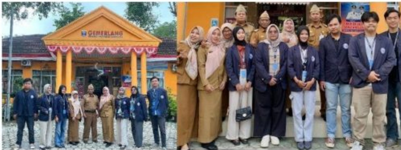
Gambar 2.3 Apel Mingguan di Kecamatan Metro Timur

Apel mingguan di Kecamatan Metro Timur dilakukan setiap hari senin pagi.