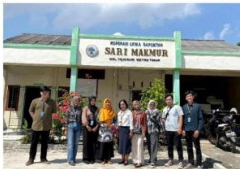
Gambar 2.4 Kunjungan ke Gabungan Kelompok Tani Kelurahan Tejosari

GAPOKTAN (Gabungan Kelompok Tani) merupakan tempat kami untuk bertanya terkait potensi pertanian dan UMKM yang ada di Kelurahan Tejosari.