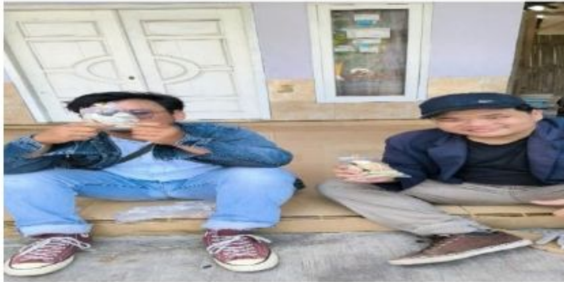
Gambar 2.2 Kunjungan ke UMKM Pempek dan Susu Kedelai