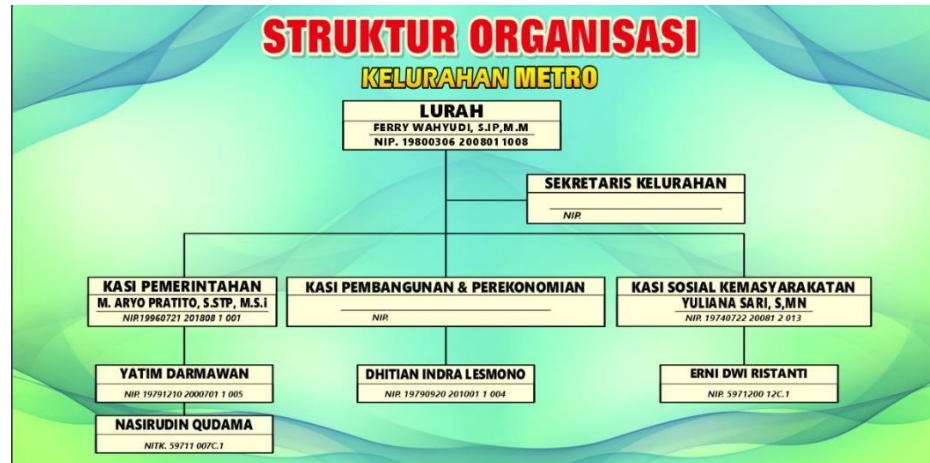
Gambar 1. 2 Struktur Organisasi Kelurahan Metro