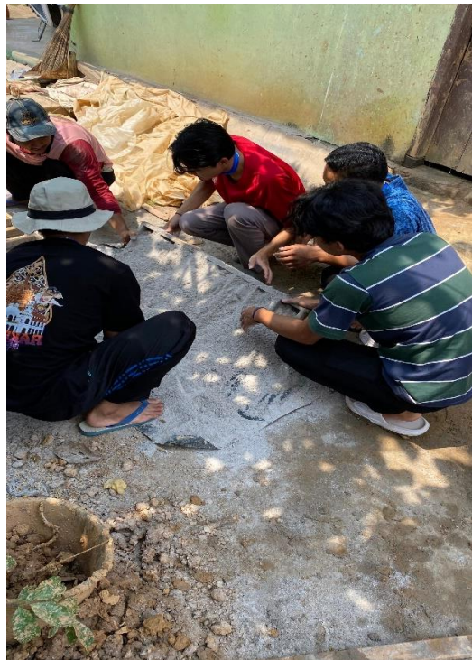
Proses pembuatan batu bata