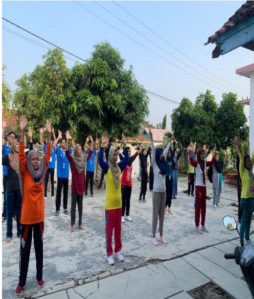
Senam bersama ibu-ibu