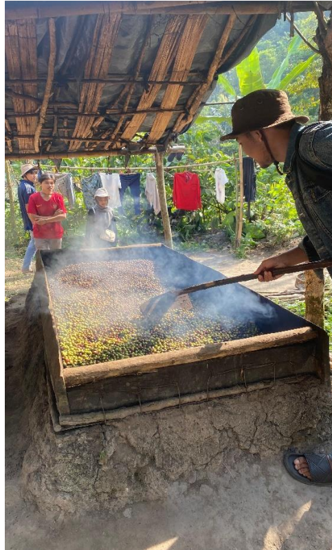
Proses pengopenan kopi