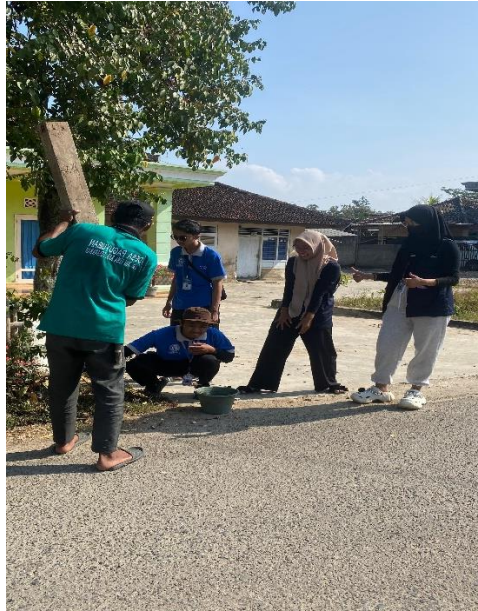
masang patok bersama warga