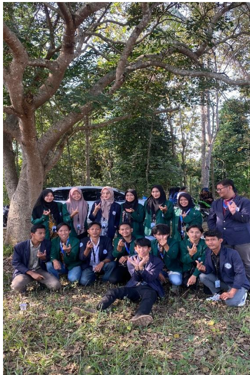
Upacara HUR RI ke-79