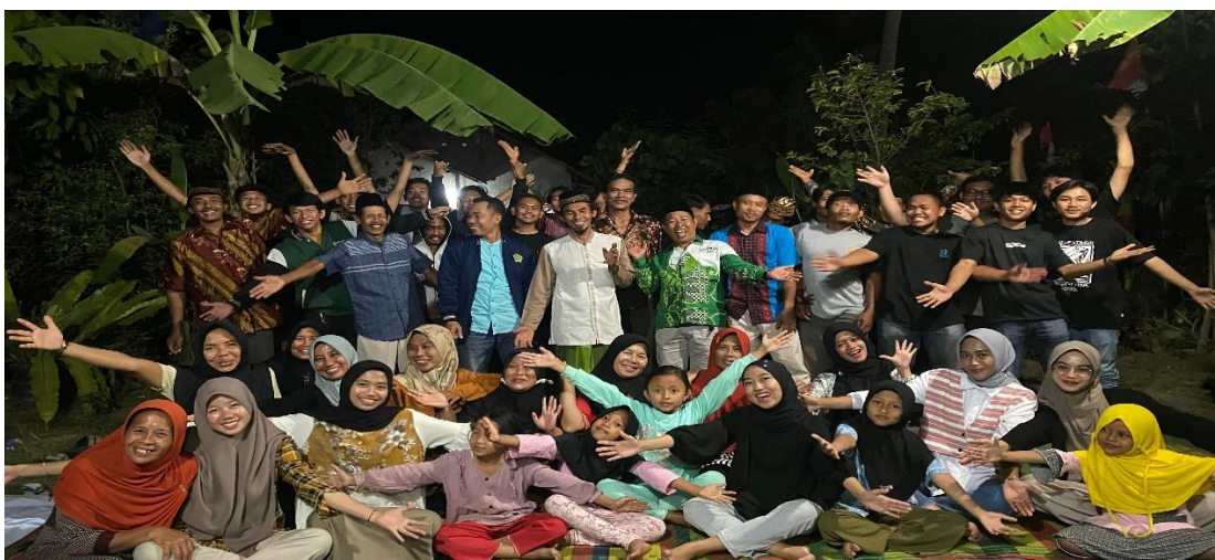
Foto bersama Warga Pertanen