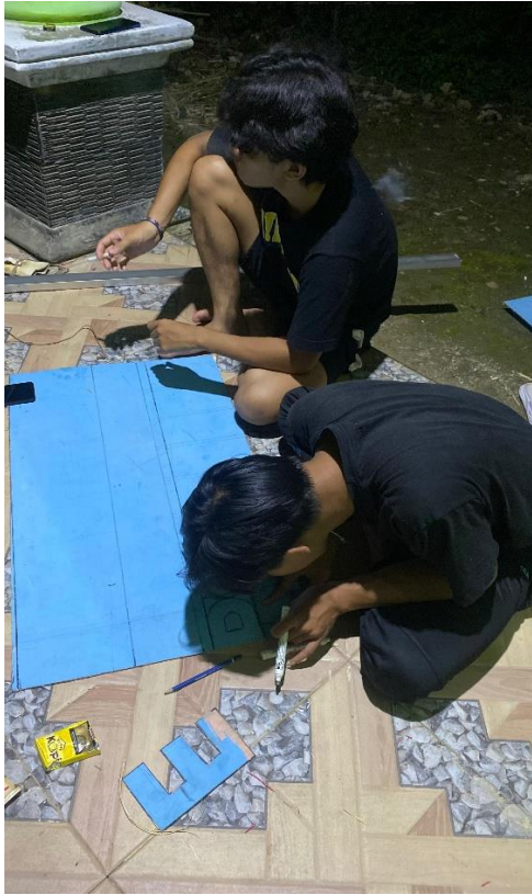
Membuat hiasan gapura