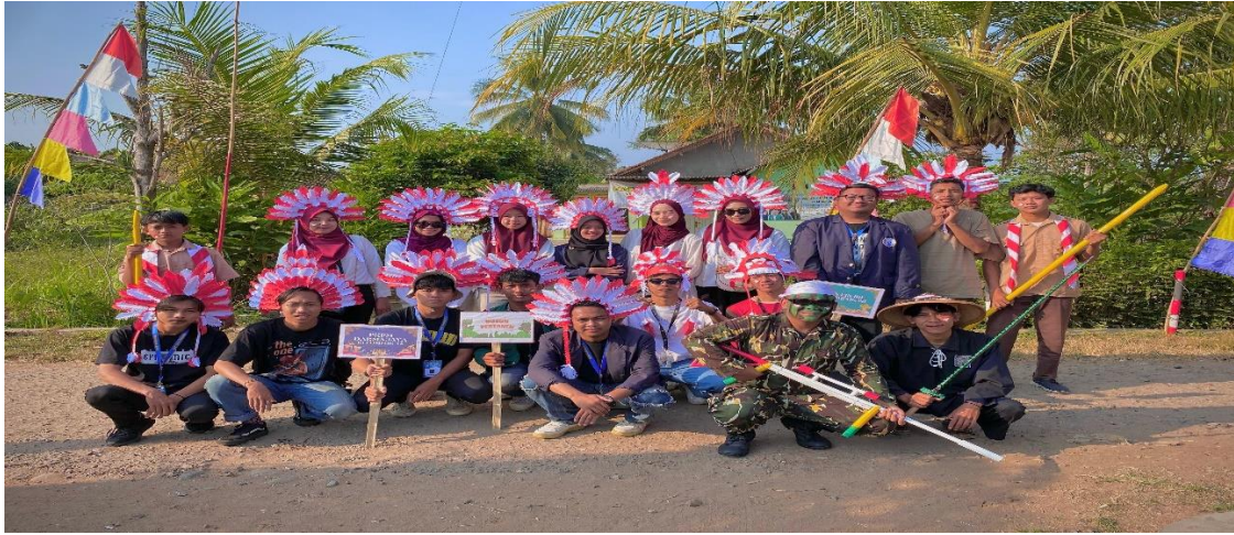
Karnaval didesa paguyuban