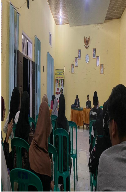
Menghadiri Rapat desa