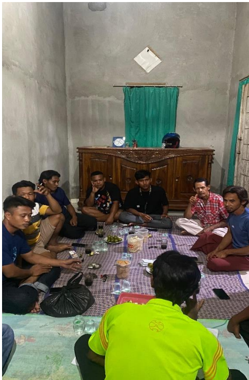
Rapat Persiapan HUT RI ke-79