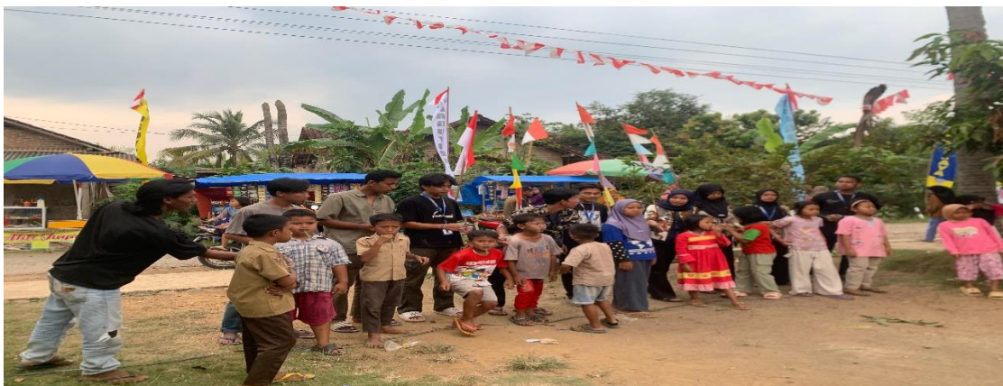
Lomba Memperingati 17 agustusan