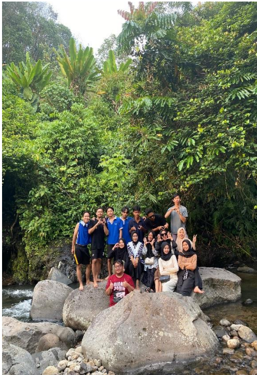
Liburan ke wai mios