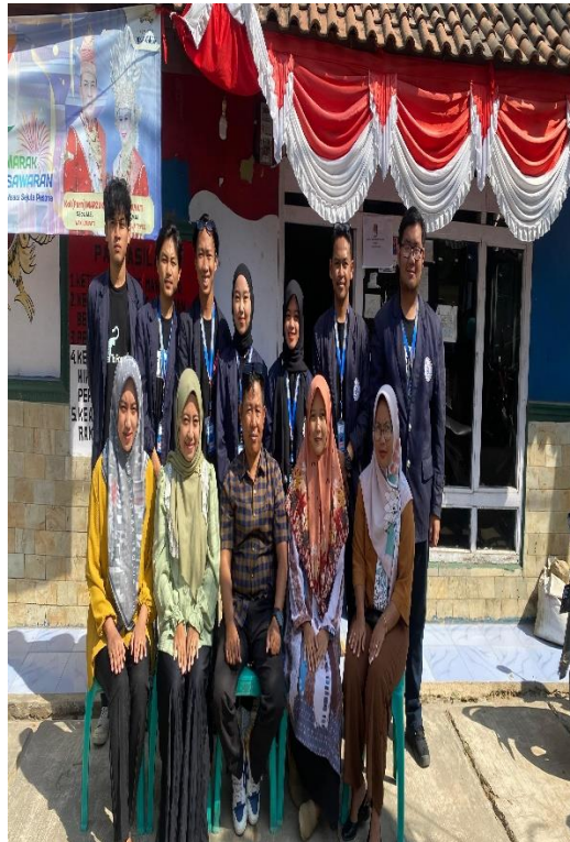
Foto bersama Kades dan Aparat