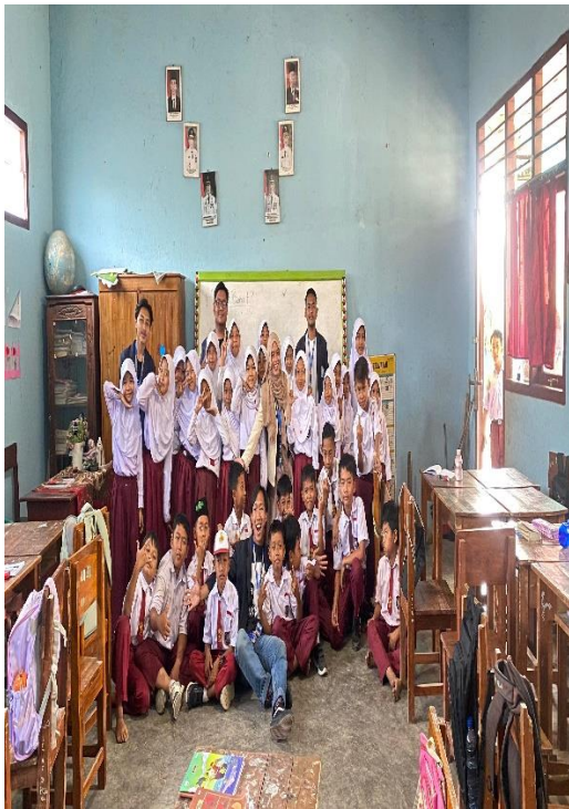
Sosialisasi di SD 04 way lima