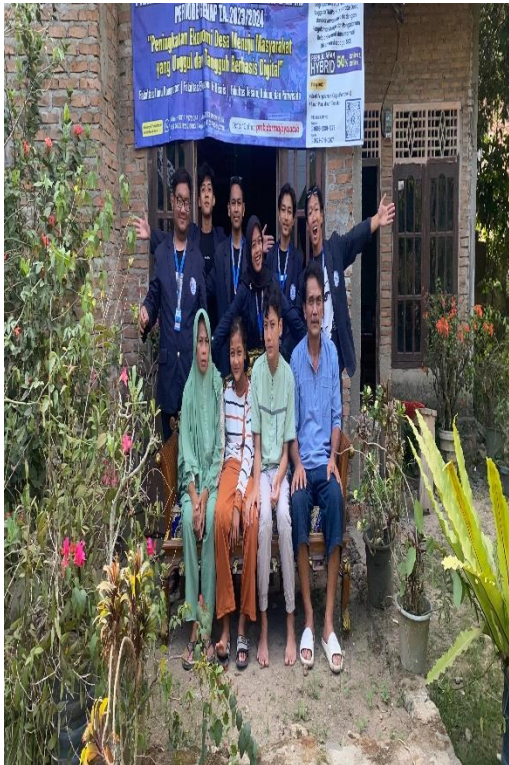
Foto keluarga Posko