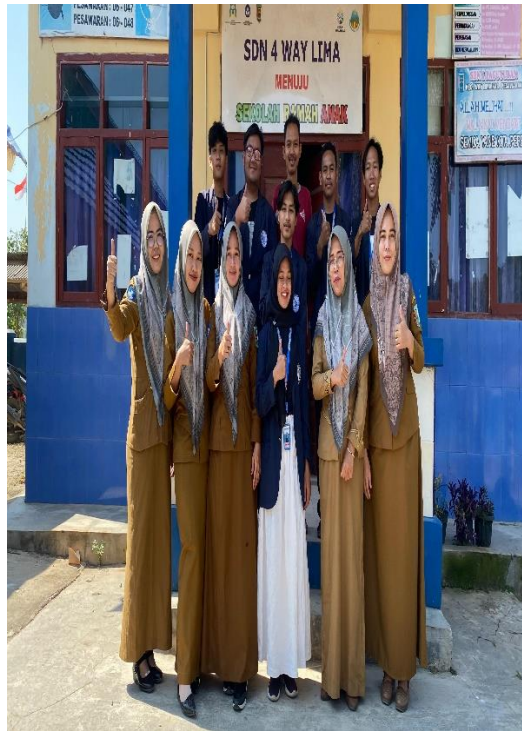
Foto bersama Guru-guru