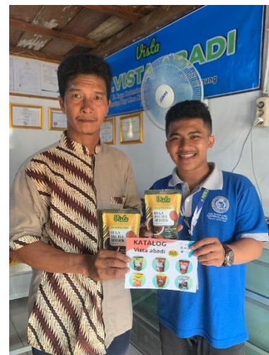
Gambar 2.1 Pelatihan serta penyerahan Aplikasi Buku Warung pada UMKM Vista Abadi