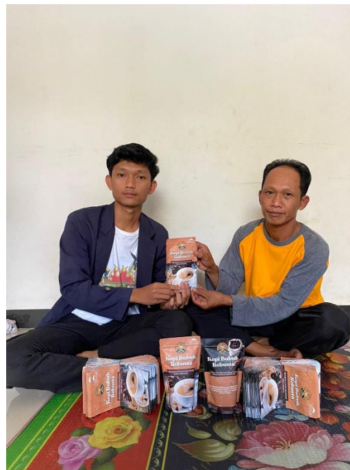
Gambar 6 Penyerahan Desain Kemasan

Penyerahan Desain Kemasan yang sudah tercetak guna untuk memiliki identitas produk di pasar yang kompetitif di Desa Sungai Langka.