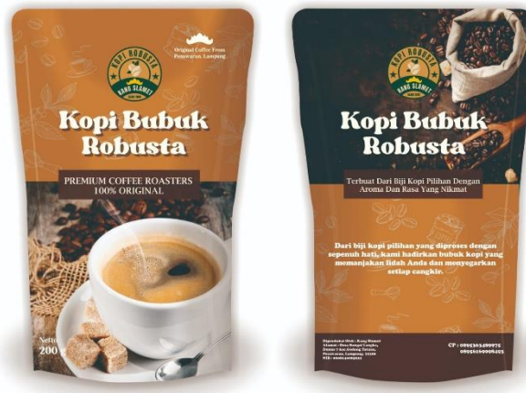
Gambar 2 Desain kemasan kopi kang slamet