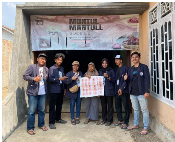
Gambar.8 Penyerahan stiker UMKM muntul mantul