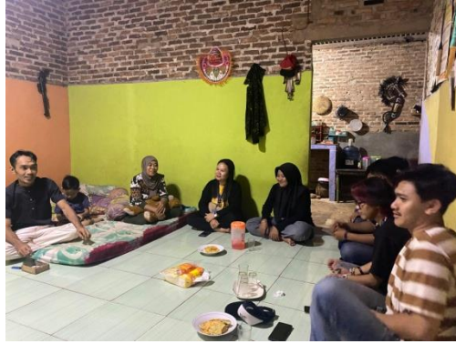
Gambar.11 Silaturahmi ke aparaturnya desa kalirejo