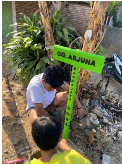
Gambar.7 Pemasangan plang jalan gang dusun mekarjaya