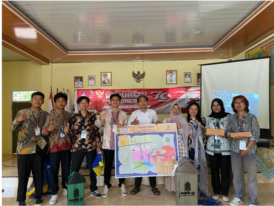
Gambar.6 Penyerahan cenderamata oleh sekretaris desa kalirejo