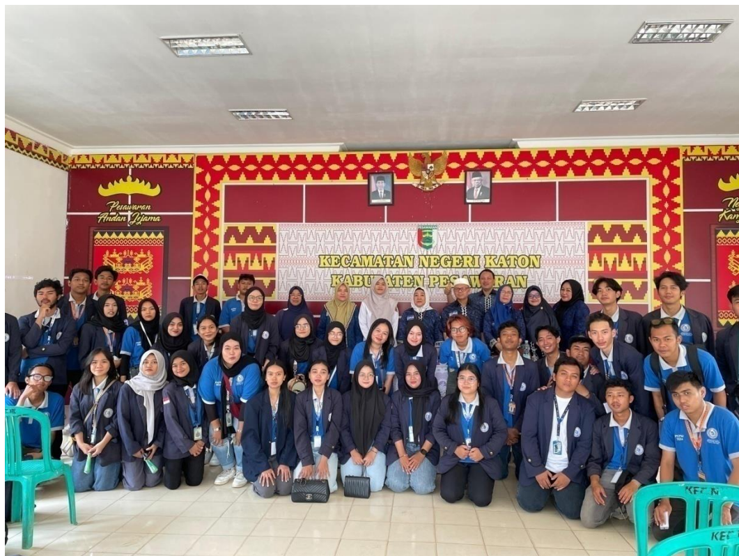
Gambar 17 Penjemputan peserta PKPM di kecamatan Negeri Katon