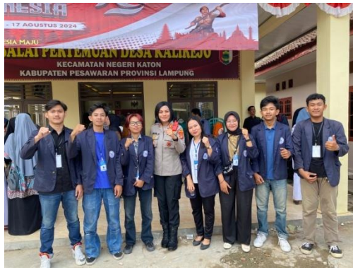
Gambar.12 Foto bersama kapolres pesawaran