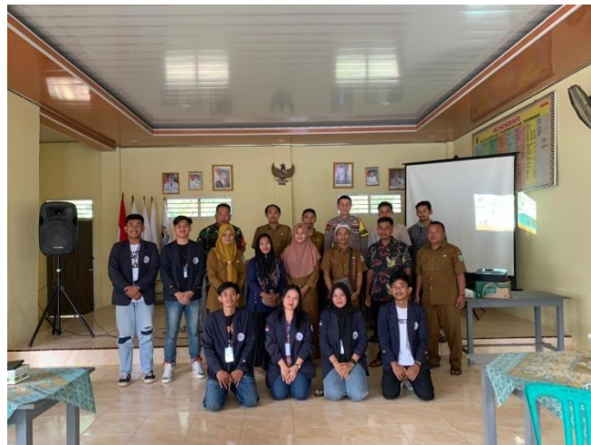
Gambar.13 Pemaparan Program Kerja Kel.33