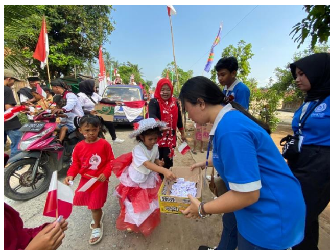
Gambar.10 Carnaval HUT RI desa kalirejo