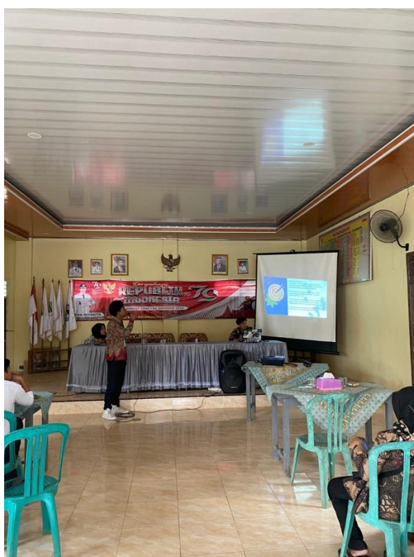
Gambar.5 Sosialisasi branding melalui canva