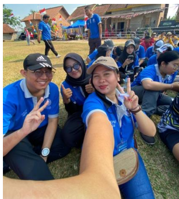
Gambar.9 Jalan sehat di desa pejambon