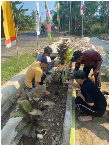
Gambar.15 Jumat Bersih