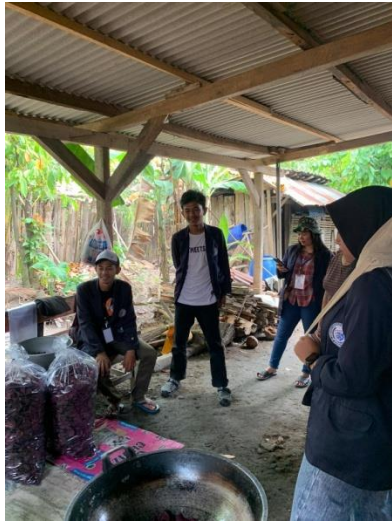
Gambar.14 Observasi UMKM Muntul Mantul