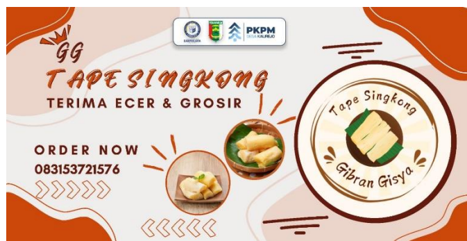
Gambar.2 Pembuatan banner pada UMKM gg tape singkong