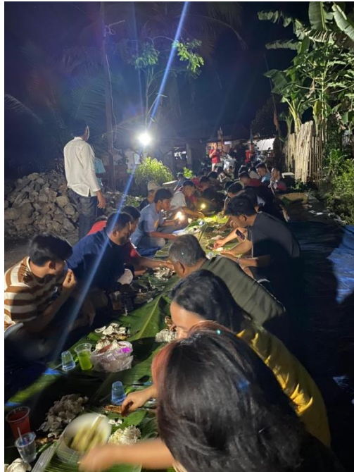
Gambar.16 Perpindahan dengan makan-makan bersama aparaturnya desa dan warga dusun mekarjaya