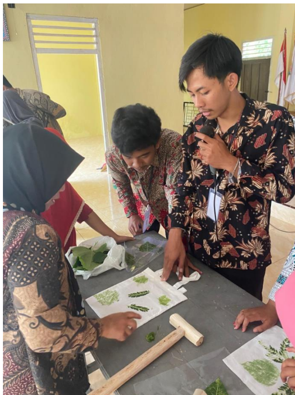
Gambar.4 Sosialisasi Ecoprint di balai desa