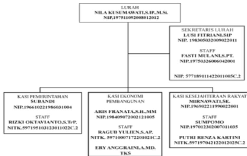
Gambar 1. 2 Struktur Organisasi Kelurahan Banjarsari