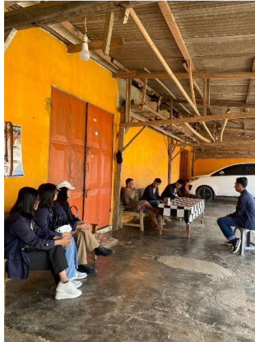
Gambar 2.3.2.2 Kunjungan dan perkenalan dengan Rw 06