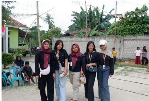
Gambar 2.3.2.5 Menjadi panitia 17 agustus

Ikut berpartisipasi dalam acara memeriahkan dirgahayu republik Indonesia yang ke-79 bersama Pemuda-pemudi setempat.