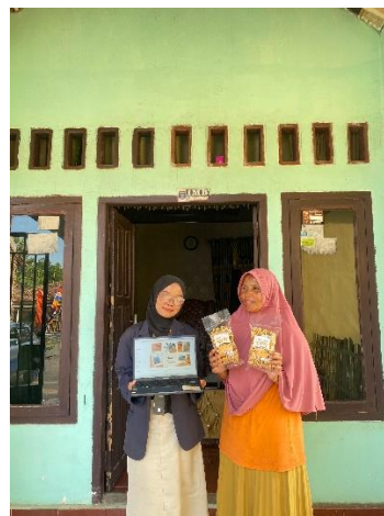
Gambar 2.3.1.6 Penyerahan kemasan baru kepada pemilik UMKM Keripik Tempe Zuvi