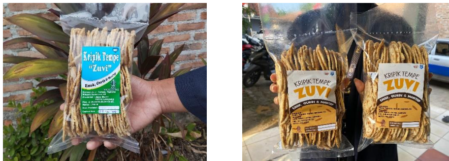
Gambar 2.3.1.5 Hasil kemasan lama dan Baru pada UMKM Keripik Tempe Zuvi