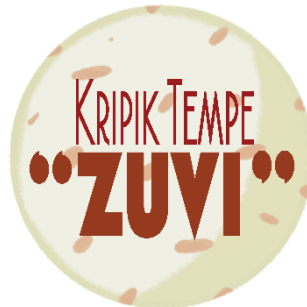
Gambar 2.3.1.3 Desain Logo Identitas UMKM Keripik Tempe Zuvi