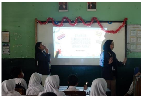
Gambar 2.3.1.2 Sosialisasi tentang bahaya gadget di SDN 06 Metro Utara