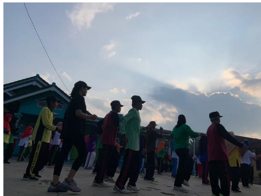
Gambar 2.3.2.3 Mengikuti senam Lansia

Mahasiswa PKPM mengikuti kegiatan senam bersama lansia di Kelurahan Karangrejo sekaligus menjalin hubungan yang baik bersama lansia-lansia di Kelurahan Karangrejo.