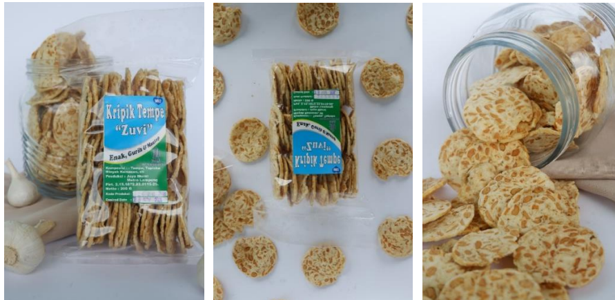
Gambar 2.3.1.7 Pemotretan foto produk UMKM Keripik tempe Zuvi