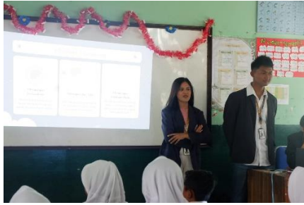
Gambar 2.3.1.1 Sosialisasi Pentingnya menabung