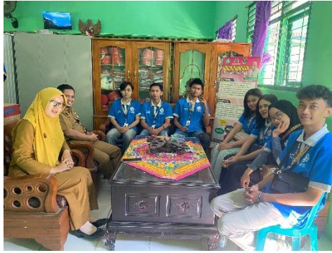
Gambar 2.3.2.4 Observasi ke SDN 06 Metro Utara