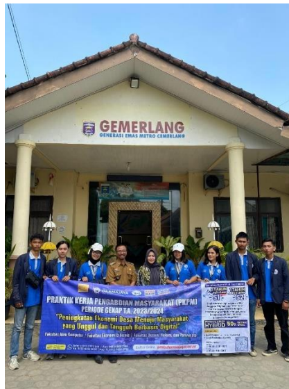
Gambar 2.3.2.1 Pelepasan Mahasiswa PKPM

Kegiatan ini merupakan awal dari pelaksanaan PKPM yang dimana DPL melepas dan memberi kepercayaan kepada mahasiswa PKPM agar dapat menjalankan Progja-progja yang telah dibuat serta membantu kegiatan-kegiatan yang ada di desa Sukajaya.