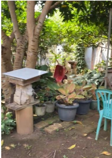
Kunjungan umkm madu klanceng