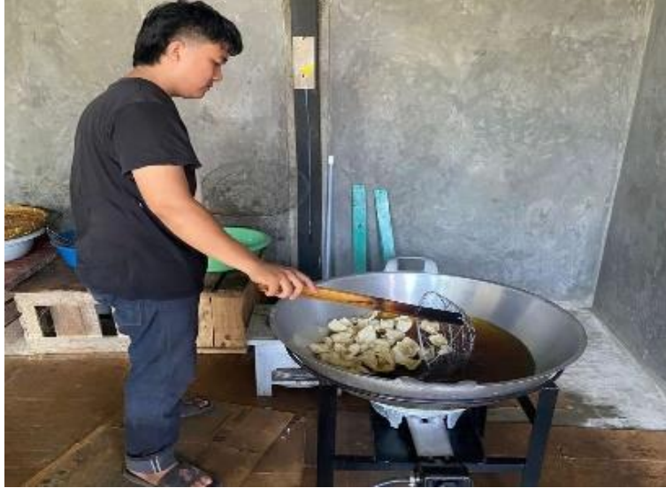
Gambar 2. 1 Proses Produksi UMKM kerupuk bawang