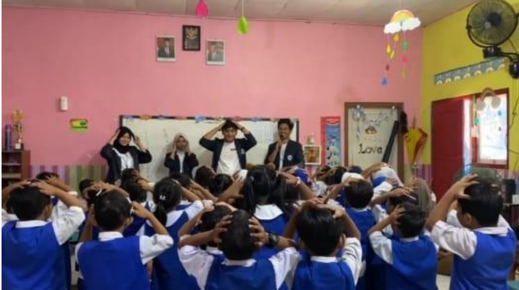
Gambar 2.3 bermain bersama anak anak tk pkk I