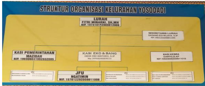
Tabel 1. 2 Struktur Organisasi Kelurahan Yosodadi