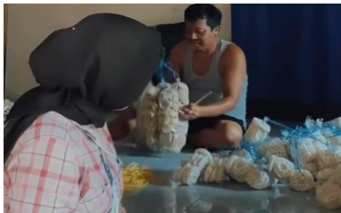
Kunjungan ke UMKM penggorengan kerupuk