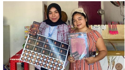
Penyerahan stiker, flyer, daftar menu & label harga UMKM Seblak 3 Tete