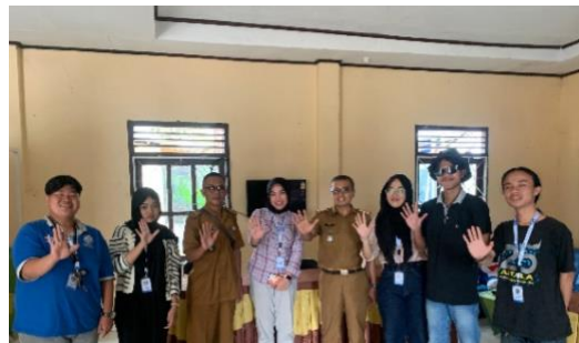
Kunjungan Camat Metro Utara dan penyampaian program kerja