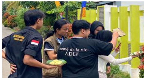
Pengambilan foto produk Cireng PMJ Dapur Umza