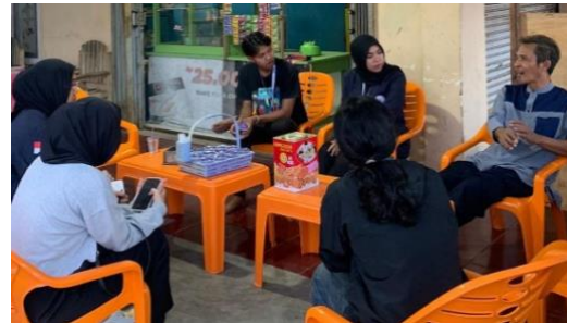
Silaturahmi ke kediaman RW Kelurahan Purwosari