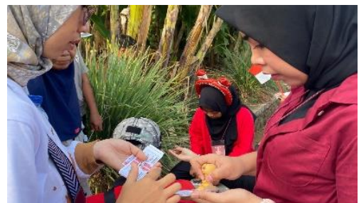
Membantu kepanitiaian jalan sehat RW 04 Kelurahan Purwosari