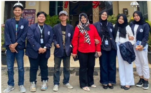
Kunjungan DPL dan pemaparan program kerja