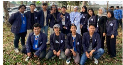
Upacara HUT RI ke-79