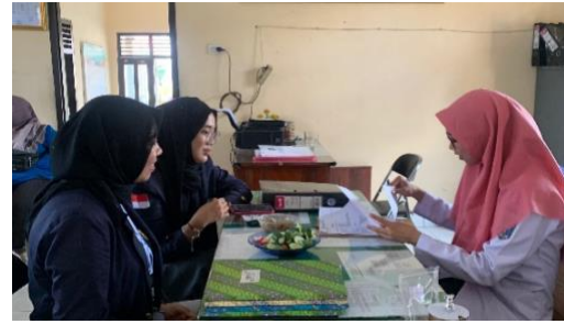
Pengecekan arsip surat keluar dan surat masuk Kelurahan Purwosari