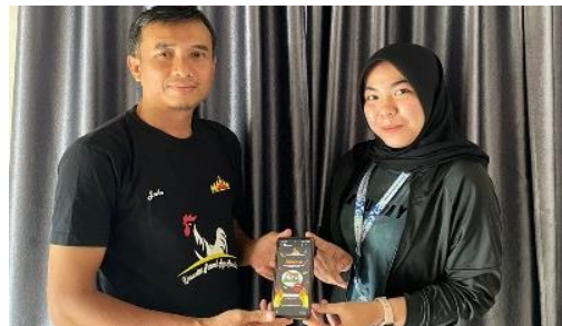
Penyerahan reels UMKM Cireng PMJ Dapur Umza