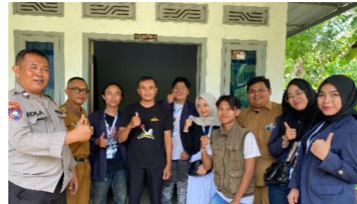
Kunjungan ke UMKM Cireng PMJ