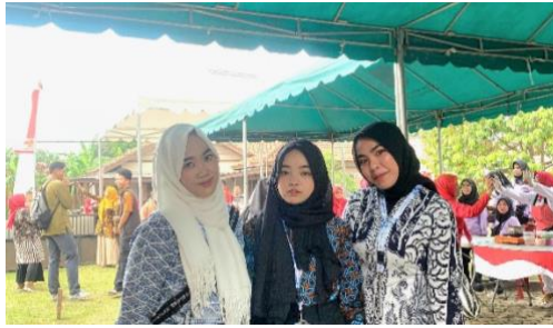
Acara royokan dan workshop Kota Metro