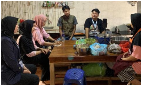
Kunjungan ke UMKM Dapur Oishi