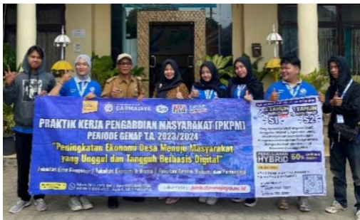
Penyerahan Mahasiswa PKPM di Kecamatan Metro Utara