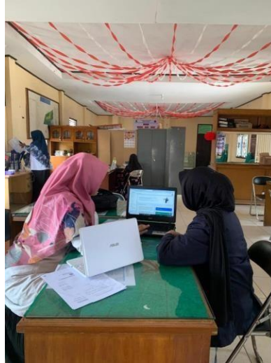
Gambar 2. 1 Konsultasi Website Kelurahan