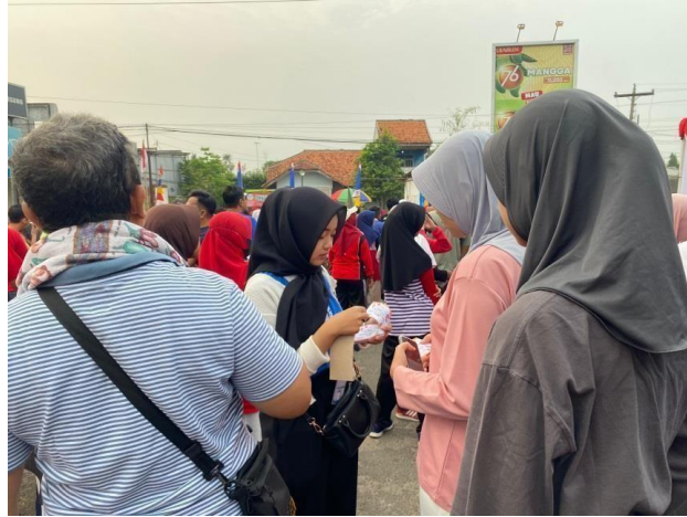
Gambar 2. 13 Jalan Sehat Purwosari dan Metro Sport Tourism