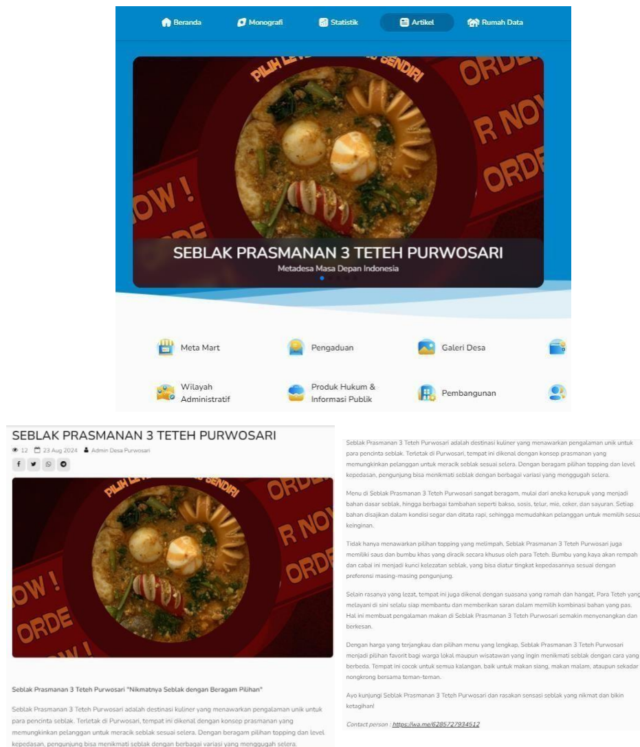
Gambar 2. 5 Artikel UMKM Seblak 3 TeteH

Sama seperti UMKM Dapur Umza (Cirieng PMJ), UMKM Seblak 3 TeteH juga belum memiliki Artikel Publik yang ada di website sso.metadesa. Pada Program Kerja ini kami membuat Artikel Website seperti berikut :