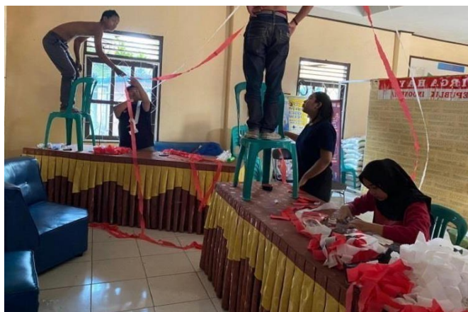
Gambar 2. 11 Dekorasi Kantor Kelurahan Purwosari

Membantu mendekorasi kantor kelurahan purwosari bersama lurah dan staf kelurahan purwosari dalam rangka HUT RI