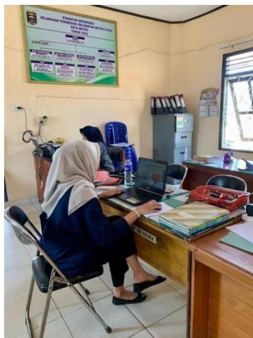
Gambar 2. 3 Proses Input Data dan Artikel UMKM Kelurahan Purwosari