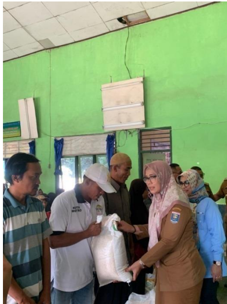
Gambar 2. 12 Pembagian Beras CPP

Beras CCP adalah bantuan beras dari pemerintah untuk masyarakat, dan diambil dikantor kelurahan purwosari, dibantu oleh staf dan mahasiswa PKPM Darmajaya.