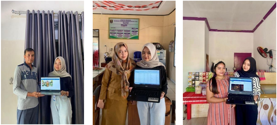
Gambar 2. 8 Penyerahan Data Penduduk dan Artikel UMKM

masih banyak lagi fitur yang ada di website Kelurahan Purwosari. Dan fitur Artikel yang digunakan untuk promosi UMKM untuk membantu peningkatan penjualan secara digital, salah satunya UMKM Dapur Oishi dan Dapur Umza.