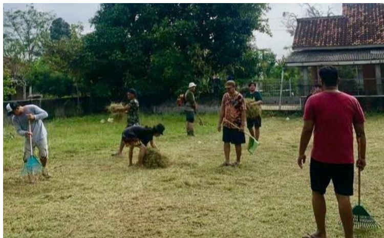
Gambar 2. 9 Gotong Royong

Dilaksanakan di RW 4 (empat) Kelurahan Purwosari dalam rangka mempersiapkan Lomba dan Jalan Sehat HUT RI KE-79.