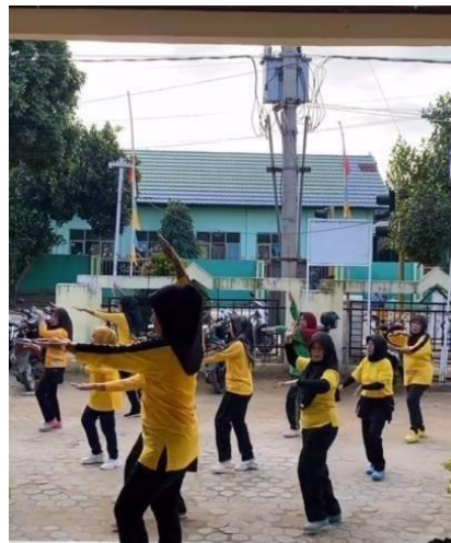
Gambar 2. 10 Senam LLC

Senam LLC ini biasanya dilakukan pada hari sabtu dan selesa di Kantor Kelurahan Purwosari. Biasanya dihadiri oleh lansia yang ada di Kelurahan Purwosari.