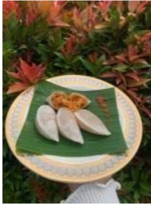
Gambar 2. 2 Foto Produk Artiel