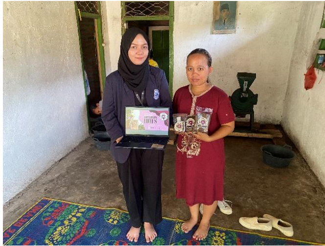
Gambar 2.3.3 Penyerahan Media Promosi Usaha

Memberikan Media promosi berupa Logo Stiker dan Design Benner untuk media promosi cetak yang digunakan oleh usaha kopi bubuk lotus, yang berada di desa Ponco Kresno, Kecamatan Negeri Katon, Pesawaran. Dengan tujuan agar usaha keripik tersebut dapat di ketahui dimana letaknya/pusat usaha tersebut.