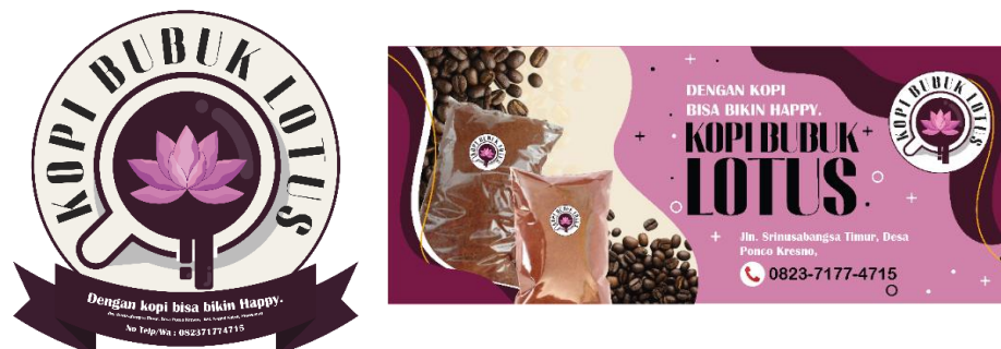
Gambar 2.3.2 Logo Terpilih dan Design Banner Kopi Bubuk Lotus