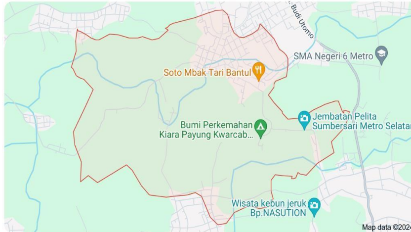
Gambar 1. 2 Peta Wilayah Sumpersari