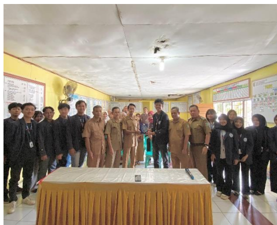
Gambar 12. Perpisahan dengan Aprat Desa Taman Sari dan Penyerahan Plakat Sebagai Kenang-Kenangan