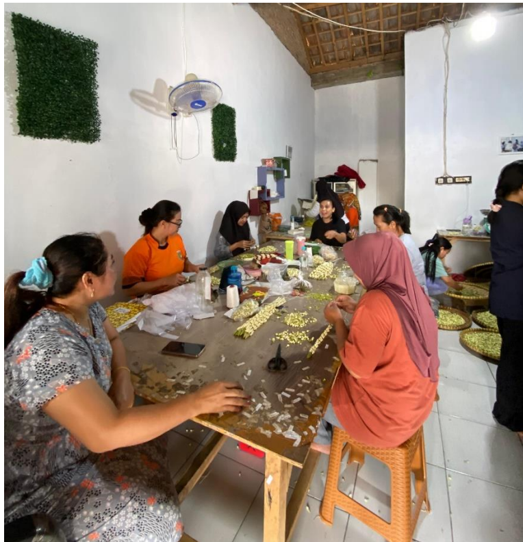
Gambar 3. Mengunjungi UMKM Bunga Melati Di Dusun Sumber Sari 2