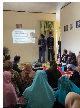
Gambar 6. Sosialisasi Mengenai inovasi branding dan mendukung tentang pentingnya pendidikan kepada pelaku UMKM di sungai langka