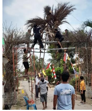
Gambar 4. Kegiatan gotong royong