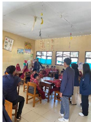
Gambar 9. Sosialisasi Ke SDN 37 Gedong Tataan Mengenai bullying dan internet sebagai media belajar