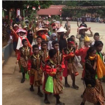
Gambar 7. Mengikuti Upacara HUT RI Ke-79 dan Menjadi Juri Karnaval