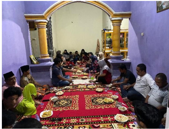
Gambar 11. Perpisahan Bersama dengan warga sekitar