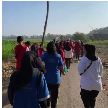
Gambar 8. Mengikuti jalan sehat