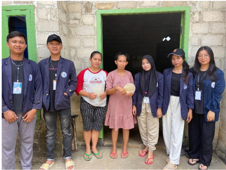
Gambar 2. Mengunjungi UMKM Opak Singkong Di Dusun Sumber Sari 4