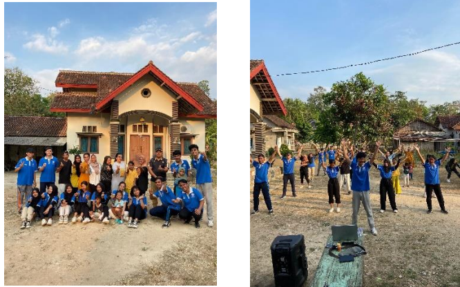
Gambar 10. Senam Bersama Ibu-Ibu Sumber Sari 2