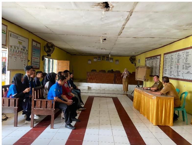
Gambar 1. Penerimaan Mahasiswa/i PKPM di Desa Taman Sari