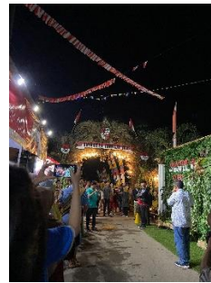
Gambar 5. Mendampingi Juri Menilai Kebersihan Antar Dusun Di Desa Taman Sari