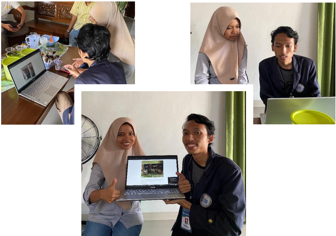
Gambar 2.2.. Hasil kegiatan pembelajaran tentang cara pembuatan dan mengatur Blog kepada pemilik UMKM Kopi Keling