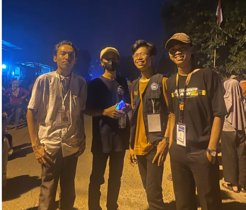
Gambar 2.4. Ikut serta menjadi Panitia Pawai Budaya HUT RI Ke-79 Kelurahan Sumber Sari Bantul