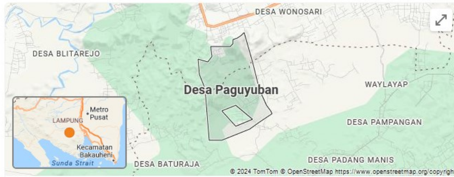
Gambar 1.1.1 Peta Desa paguyuban

Desa Paguyuban merupakan salah satu Desa dengan status Mandiri di Provinsi Lampung yang sebelumnya Desa berkembang berdasarkan Peraturan Menteri Desa dan Pembangunan Daerah Tertinggal tentang Indeks Desa Membangun. Untuk mencapai kemandirian Desa, Pemerintah Desa Paguyuban melakukan berbagai upaya berupa strategi-strategi dalam meningkatkan status Desa, sehingga menjadi salah satu Desa Mandiri di Provinsi Lampung. Penelitian ini bertujuan untuk mengetahui strategi yang dilakukan Pemerintah Desa Paguyuban dalam meningkatkan status Desa menuju 5 Desa Mandiri. Metode yang digunakan adalah deskriptif kualitatif dengan menggunakan wawancara mendalam, observasi, dokumentasi. Hasil penelitian menunjukkan bahwa strategi yang dilakukan oleh Pemerintah Desa Paguyuban menggunakan yaitu: