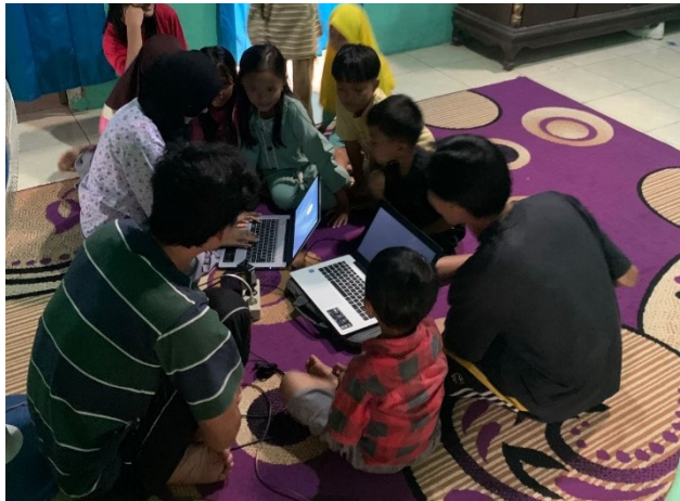
Gambar 2.3 Kegiatan Proses Belajar

Berdasarkan kegiatan yang telah dilaksanakan, dapat menghasilkan sebuah pemanfaatan teknologi untuk anak – anak Desa Paguyuban, dengan adanya kegiatan belajar ini anak – anak Desa Paguyuban dapat mengetahui aplikasi – aplikasi yang dapat digunakan untuk meningkatkan skill, kreatifitas, dan inovasi mereka.