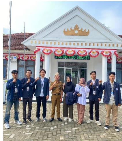
Kegiatan Apel pagi di kantor kecamatan bersama dengan anggota kelurahan dan camat.