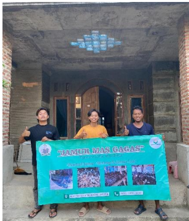
Pemasangan Banner UMKM Jamur Merang Mas Gagah.