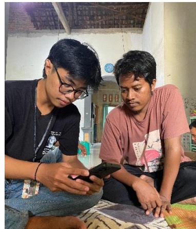
Pembuatan account google my bussines pada UMKM jamur merang mas gagas