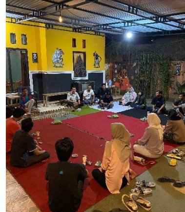
Pertemuan dengan panitia serta remaja dari jajaran karang taruna.