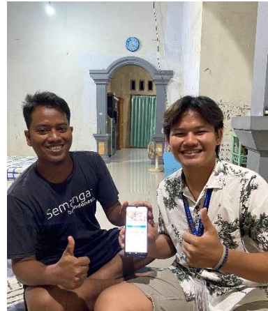
Survey UMKM Jamur Merang (Pengambilan Dokumentasi)