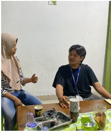
Pembuatan Akun Sosial Media (Instagram dan Facebook Marketplace) UMKM Kopi Keling. (Part II)