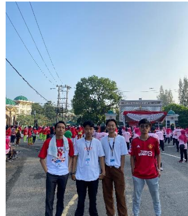
Mengikuti acara senam ber-temakan Car Free Day di metro pusat.