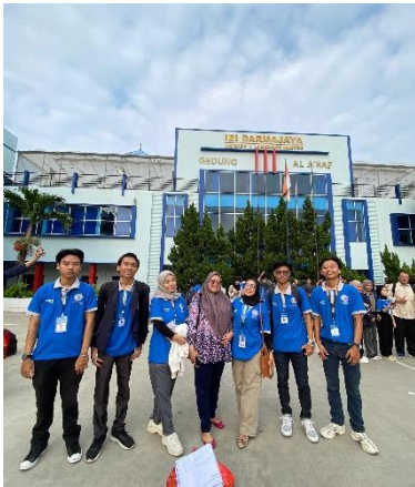
Acara pelepasan Mahasiswa PKPM di Lapangan Basket IIB Darmajaya