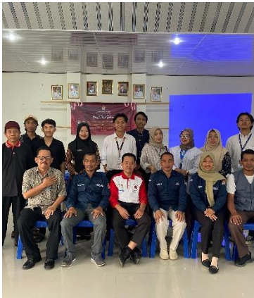
Kegiatan rapat 'Pleno (Pemilihan calon gubernur/wakil gubernur).