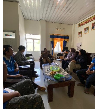
Pertemuan DPL Bersama peserta PKPM dengan bapak lurah di kantor kelurahan sumbersari Bantul.