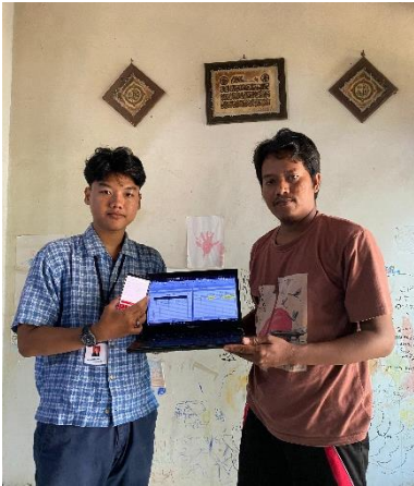
Penyerahan laporan keuangan sederhana pada UMKM Jamur Merang Mas Gagas.