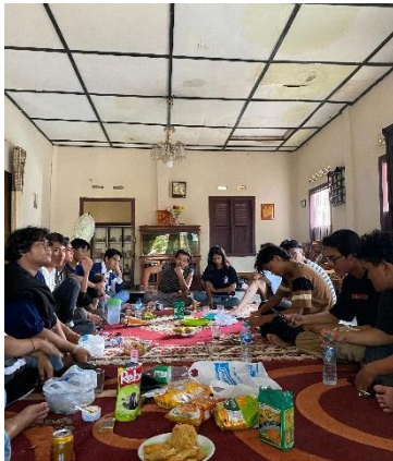
Rapat kegiatan workshop bersama kelompok lain yang berada di Metro Selatan (Part II)