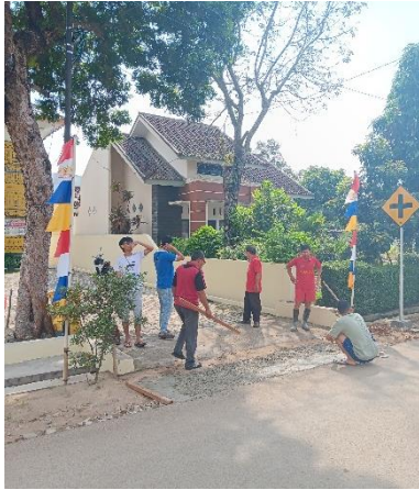
Kegiatan bersih-bersih kelurahan sumbersari Bantul