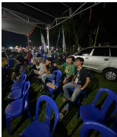
Kegiatan melihat pawai 17-an di kelurahan margodadi.