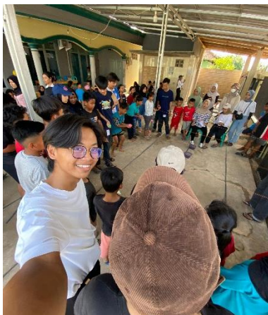
Kegiatan pengawasan panitia lomba ibu/anak-anak.