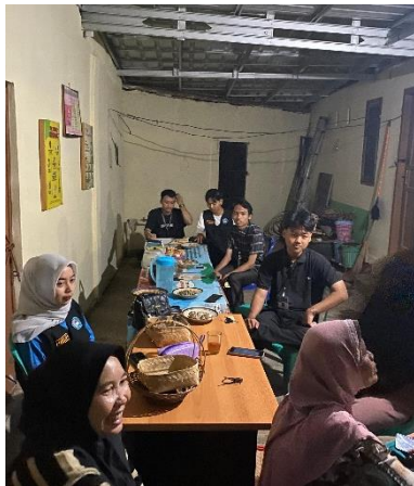
Kegiatan pelatihan fashion show KWT (Kelompok Wanita Tani).