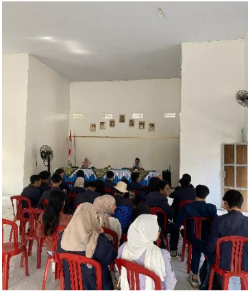
Kegiatan pembahasan seputar PKPM di kantor kecamatan.