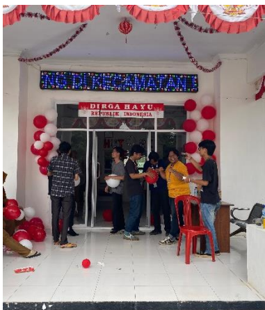
Kegiatan menghias kantor kecamatan acara 17 Agustus-an.