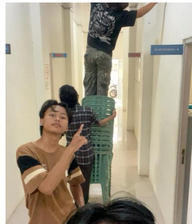
Kegiatan menghias kantor kelurahan acara 17 Agustus-an.