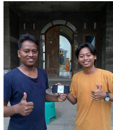
Penyerahan Logo UMKM Jamur Merang Mas Gagah.