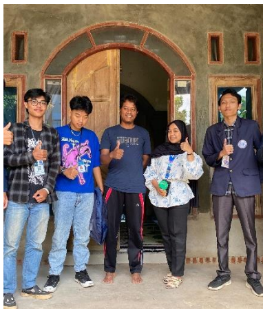
Survey UMKM penghasil Jamur Merang.