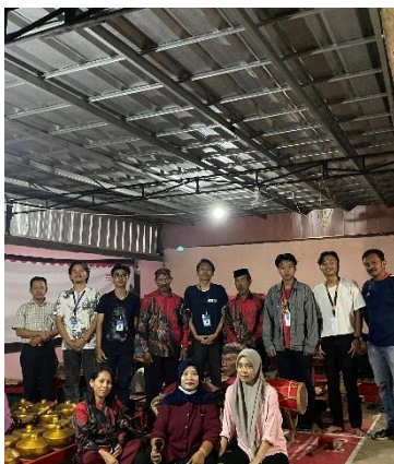
Kegiatan penutupan Suroan dengan menampilkan music khas jawa