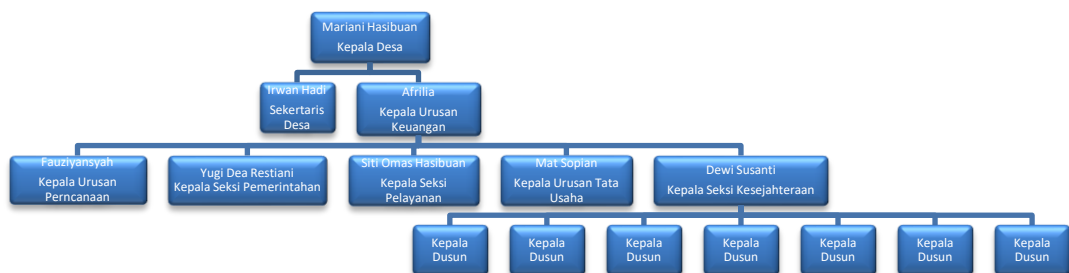
Gambar 1.2 Struktur Organisasi

Semenjak berdiri sampai dengan saat ini desa Ponco Kresno telah dipimpin oleh beberapa kepala desa sebagai berikut: