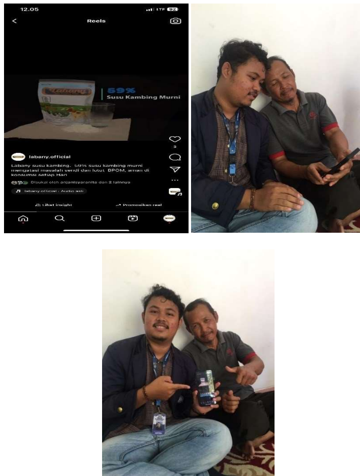
Gambar 2.4 Pengunggahan Vidio Iklan dan pelatihan singkat mengelola konten

Vidio yang telah selesai diproduksi kemudian di unggah ke platform digital seperti media social ( Instagram ). Selain itu pemilik UMKM di beri pelatihan singkat tentang cara mengelola konten Vidio iklan di media social.