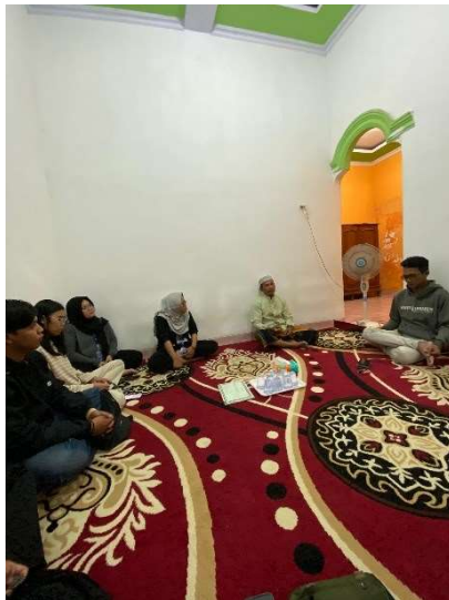
Gambar 2.2 Perancangan konsep Vidio Iklan

Setelah melakukan observasi, selanjutnya yaitu menyusun konsep video iklan dengan mempertimbangkan pesan yang ingin disampaikan seperti Keunggulan dan Manfaat dari Susu Kambing Labany dan gaya penyampaian yang menarik.