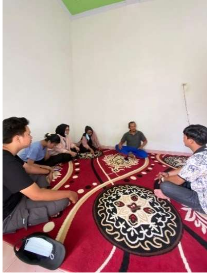
Gambar 2.1 Observasi menentukan target dan kebutuhan pemasaran