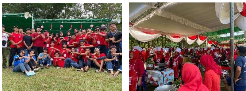
Gambar 2.6 Mengikuti Kepanitiaan HUT RI

Acara HUT RI untuk memperingati hari Kemerdekaan Bangsa Indonesia. Perayaan HUT RI ke 79 di Kelurahan Yosomulyo dilakukan mulai tanggal 17- 25 Agustus 2024, rangkaian kegiatan yang dilakukan berupa berbagai lomba, jalan sehat, hingga karnaval. Kegiatan ini merupakan kegiatan rutin yang dilakukan secara meriah setiap tahunnya oleh masyarakat Yosomulyo.