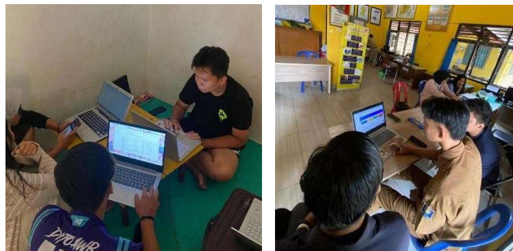
Gambar 2.4 Penginputan data BPS Kota Metro

Pada kegiatan penginputan data penduduk di aplikasi Sitanduk BPS Kota Metro ini dilakukan untuk membantu Kelurahan Yosomulyo mendaftarkan data pribadi penduduk yang ada di Yosomulyo. Pada kegiatan ini kami membantu penginputan data penduduk sekitar kurang lebih 3.272 kartu keluarga.