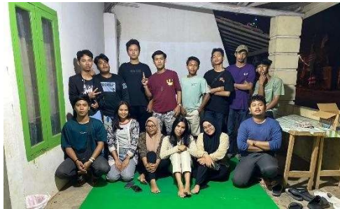
Gambar 2.7 Kegiatan Makan Bersama Masyarakat Sekitar

Kegiatan ini diadakan di salah satu rumah warga bersama pemuda pemudi RW 09 kelurahan Yosomulyo. Dengan diadakannya kegiatan ini bertujuan mempererat silaturahmi dengan masyarakat sekitar serta mengucapkan terimakasih atas penerimaan dan kerjasama kurang lebih sebulan selama PKPM berlangsung dengan harapan meninggalkan kesan baik dan positif.