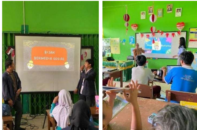
Gambar 2.5 Sosialisasi Bijak Media Sosial dan Bullying

Kegiatan ini merupakan kegiatan penting diberikan kepada siswa siswi sekolah dasar mengingat tujuan menanamkan nilai dan norma bertingkah laku yang baik dan benar harus ditanamkan sejak dini.