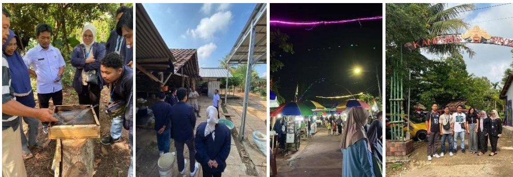
Gambar 2.4 Kunjungan UMKM yang ada Di Kelurahan Yosomulyo

Kegiatan Kunjungan seluruh UMKM di Yosomulyo merupakan kegiatan kelompok pertama yang bertujuan untuk mengetahui UMKM di kelurahan Yosomulyo yang belum memiliki potensi untuk mengembangkan bisnis. Dalam kegiatan ini kelompok akan memilah UMKM akan difokuskan untuk dibantu mengembangkan usaha yang nantinya menjadi bagian dari program kerja