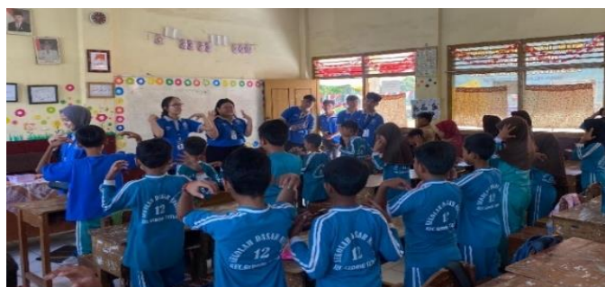
Gambar 2. 5 berkunjung ke SDN 12 Gedong tataan

Berkunjung ke SDN 12 Gedong Tataan memberikan motivasi kepada adik-adik dan bermain sambil belajar.