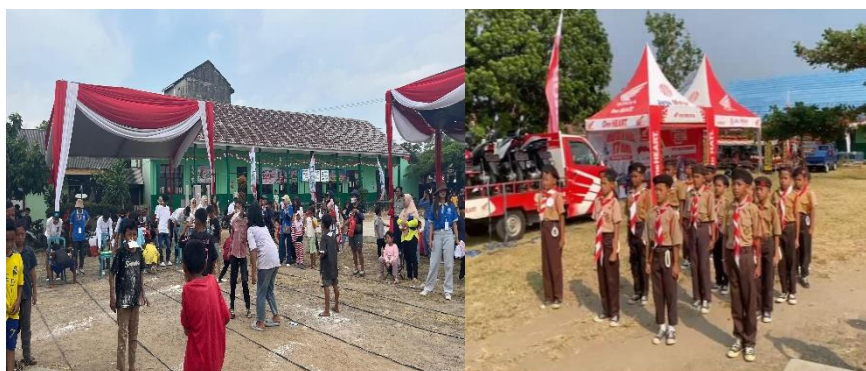
Gambar 2. 13 berpartisipasi dalam rangka HUT RI Ke-79

Menjadi Koordinator Gerak Jalan dan Lomba Tradisional serta panitia lainnya.