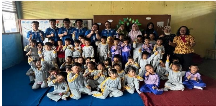
Gambar 2. 6 berkunjung ke TK Dharma wanita

Berkunjung ke TK Dharma Wanita belajar berhitung sambil bermain.