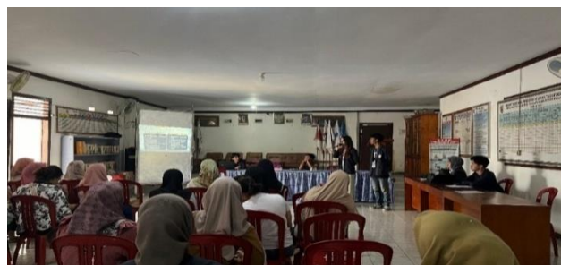
Gambar 2. 2 pemaparan materi digitalisasi

Target peserta dalam kegiatan ini yaitu Pelaku UMKM di Desa Wiyono dengan tujuan agar para pelaku UMKM di Desa Wiyono bisa lebih berkembang. Adapun materi yang disampaikan dalam seminar tersebut yaitu deskripsi UMKM, Branding, E-Commerce , Media Sosial serta Konten Marketing.