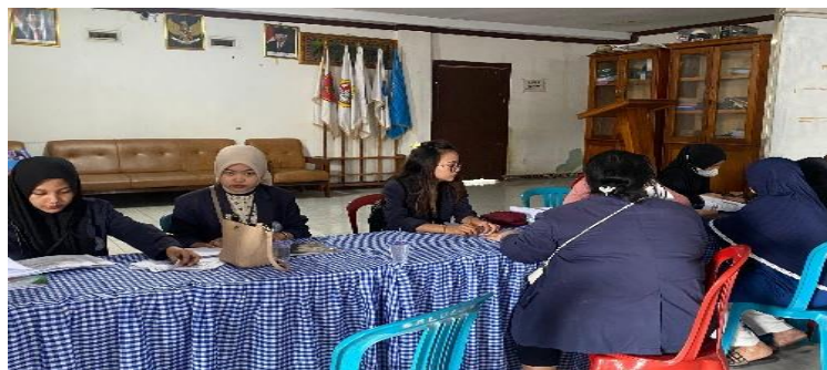
Gambar 2. 12 Menghadiri posyandu lansia

Menghadiri posyandu lansia dan membantu mengukur tinggi badan dan mendata peserta.