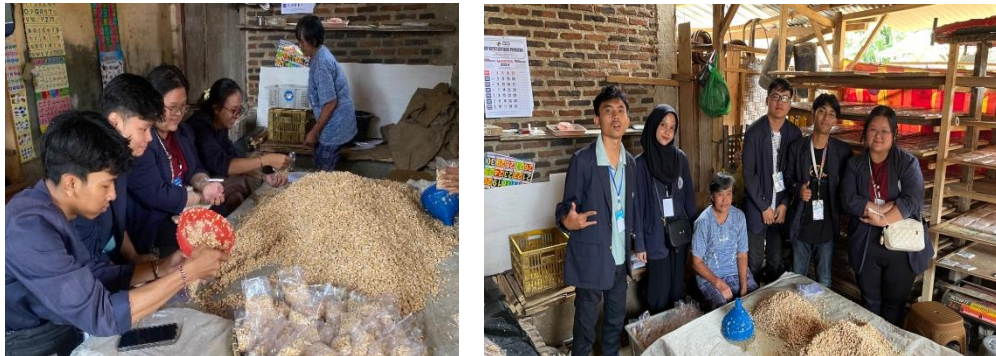
Gambar 2. 7 berkunjung ke UMKM Tempe

Berkunjung ke UMKM Tempe di desa Wiyono dan melihat cara pemuatannya.