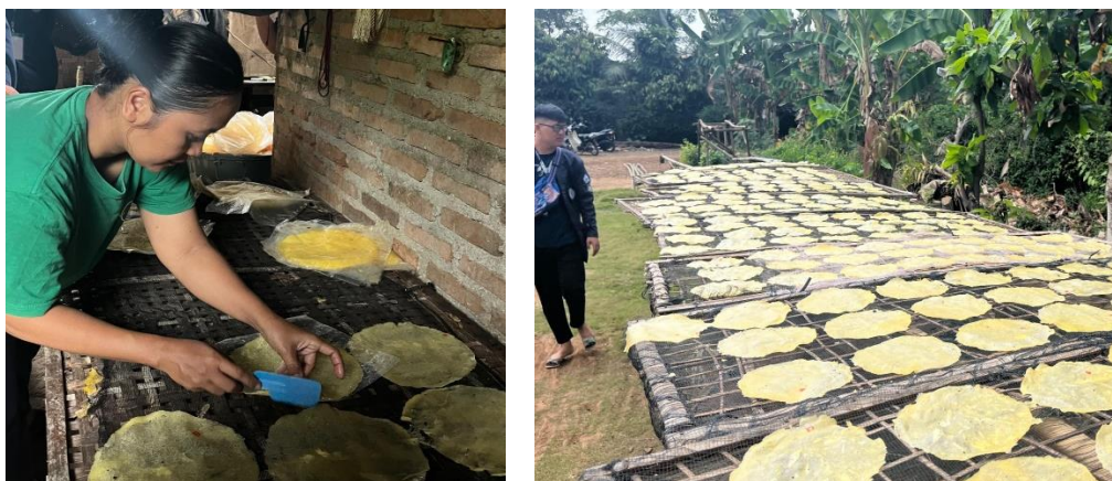
Gambar 2. 8 berkunjung ke UMKM Opak

Berkunjung Ke UMKM Opak di desa Candiharjo dan melihat cara pembuatannya.