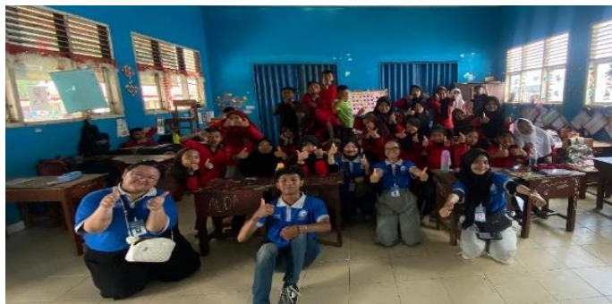
Gambar 2. 4 berkunjung ke SDN 01 Gedong Tataan

Berkunjung ke SDN 01 Gedong Tataan memberikan motivasi kepada adik-adik Dan bermain sambil belajar.