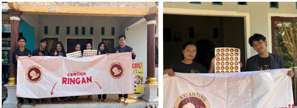
Gambar 2. 10 Menyerahkan benner, stiker kepada UMKM

Setelah diizinkan untuk membantu mengembangkan usahanya, kami memberikan stiker logo dan banner kepada UMKM Klanting Getuk Gepeng.