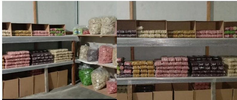
Gambar 2. 9 Berkunjung ke UMKM Rengginang

Berkunjung ke UMKM Rengginang di desa Way Hui Dan Melihat cara pembuatannya.