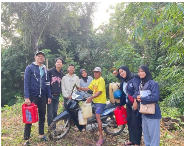
Melihat Proses Pengambilan Nira