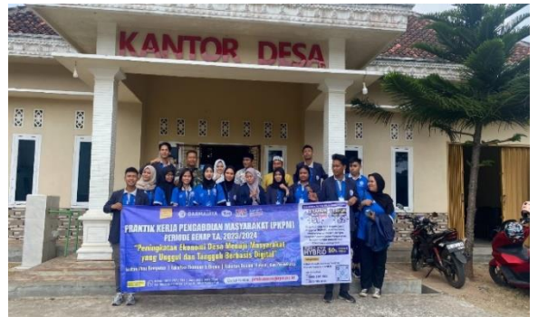
Penerimaan Mahasiswa PKPM di Balai Desa