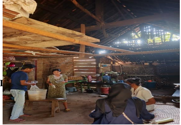
Kunjungan ke UMKM Mangleng & Marning Mbah Sungkem