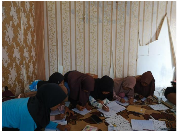
Lampiran 1.20 Mengadakan Rumah Belajar