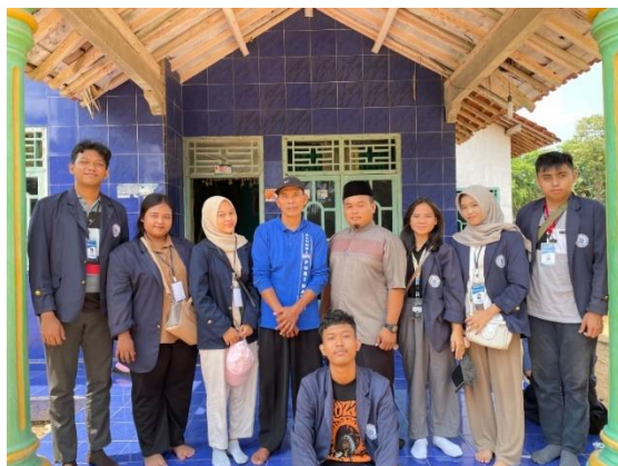
Kunjungan ke rumah Kepala Dusun 4