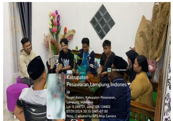
Kunjungan ke Rumah Kepala Dusun 5