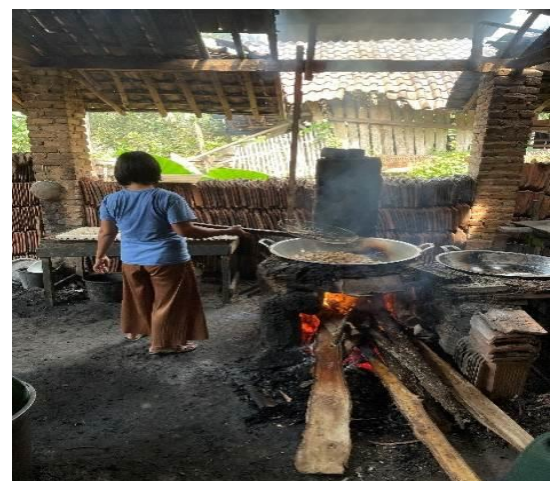
Lampiran 1.18 Kunjungan UMKM Pembuatan Tempe dan Tahu