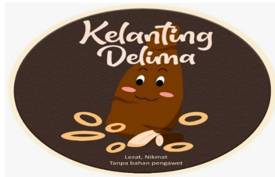
Gambar 3 Logo untuk Kemasan

Pembuatan desain packaging menjadi salah satu pemicu penjualan dalam sebuah produk karena berdasarkan fungsinya. Desain packaging merupakan suatu nilai tambah yang dapat dijadikan sebagai perangkat emosional yang paling ampuh untuk menjaring konsumen. Oleh sebab itu desain kemasan memiliki pengaruh yang besar terhadap terhadap minat beli konsumen