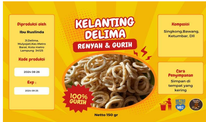
Gambar 4 Label Untuk Kemasan