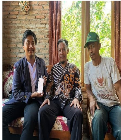
Gambar 2.6 Melakukan Pendaftaran Akun Instagram

Marketplace merupakan salah satu platform jual beli yang bisa dimanfaatkan sebagai sarana promosi secara gratis. Tidak perlu pungutan biaya lainnya untuk mempromosikan setiap produk yang ingin dipasarkan. Dengan begitu, bisa lebih menghemat biaya saat ingin memulai usaha sehingga kami untuk saat ini fokus memasarkan produk melalui platform Instagram. Berikut adalah gambar proses pembuatan akun Instagram :