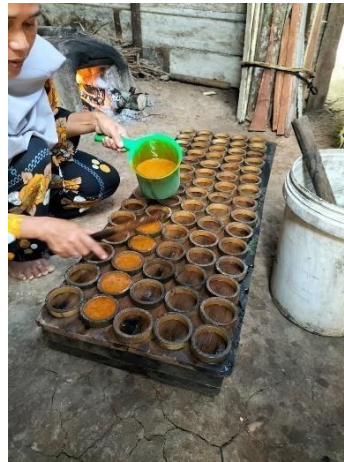
Gambar 2.3 Menyetak Gula Merah

Tahap ketiga yang dilakukan saat produksi yaitu menyetak nira kelapa yang sudah mengental.