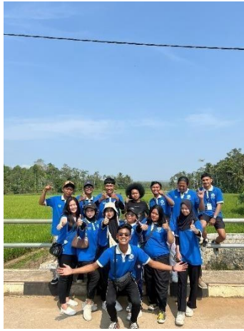
Gambar 2.9 Mengikuti Acara jalan jalan sehat

PKPM Darmajaya mendapatkan amanat untuk menjadi panitia Acara jalan sehat yang dilaksanakan di Dusun Kampung Sawah Desa Kebagusan pada hari Minggu 25 Agustus 2024, yang merupakan juga salah satu dari kegiatan acara 17 Agustus 2024.