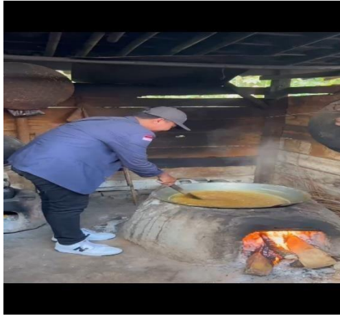
Gambar 2.2 Proses memasak nira kelapa

Tahap kedua yang dilakukan saat produksi yaitu memasak nira kelapa hingga mengental