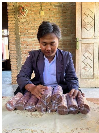
Gambar 2.5 Mengemas Gula Merah

Tahap kelima yang dilakukan saat produksi yaitu mengemas gula merah yang sudah di lepaskan dari cetakan.