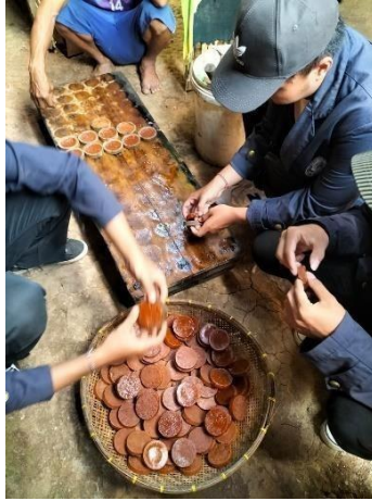
Gambar 2.4 Melepaskan Gula merah dari cetakan

Tahap keempat yang dilakukan saat produksi yaitu melepaskan gula merah yang udah mengeras dari cetakan