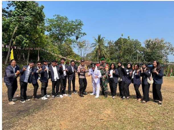
Gambar 2.8 Mengikuti Upacara HUT RI KE- 79

Pada Memperingati HUT RI KE-79 Kami mengikuti Upacara Bendera dilapanagan Dusun Triharjo Desa Kebagusan Dalam dihadiri ole banyak elemen masyarakat maupun instasnsi intsansi kepemerintahan. Pada Gambar dibawah ini