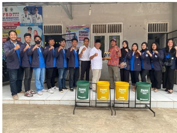
Gamabar 2.10 Pemberian Plakat dan Kotak Sampah

PKPM Darmajaya melakukan pemberian Plakat dan kotak sampah kepada perangkat Desa Kebagusan.