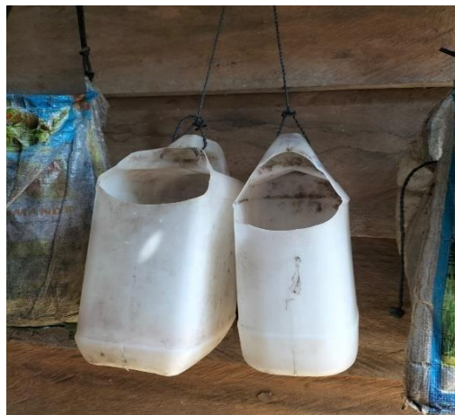
Gambar 2.1 Nira Kelapa yang sudah di ambil

Tahap pertama yang dilakukan sebelum produksi Gula Merah yaitu mencari nira kelapa.