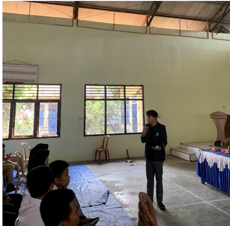
Gambar 2. 4 Sosialisasi Forum Remaja

Selain sosialisasi Forum Anak, Kelurahan Ganjar Agung juga melakukan sosialisasi Forum Remaja dengan kami mengisi materi tentang 3 CARA Bertahan Hidup Dimasa Depan. Dengan dihadiri oleh beberapa SMA & SMP yang ada di Kelurahan Ganjar Agung. Dengan adanya kegiatan ini diharapkan dapat memberikan motivasi dan pengetahuan baru bagi anak remaja yang sedang memerlukan arahan dan dampingan untuk dapat meneruskan masa depan bangsa.