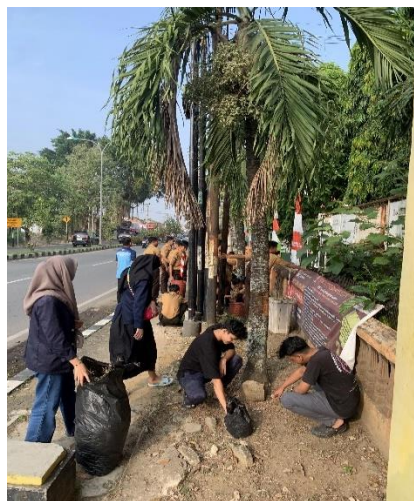
Gambar 2. 7 Gotong Royong

Setiap hari jumat Kelurahan Ganjar Agung memiliki kegiatan Gotong Royong yang selalu dilaksanakan bersama anak –anak sekolah di sekitar Kelurahan Ganjar Agung maupun staff yang ada di Kelurahan turut ikut andil dalam kegiatan gotong royong ini, tujuan dari gotong royong ini adalah menumbuhkan sikap saling membantu antar masyarakat dan meningkatkan rasa solidaritas.