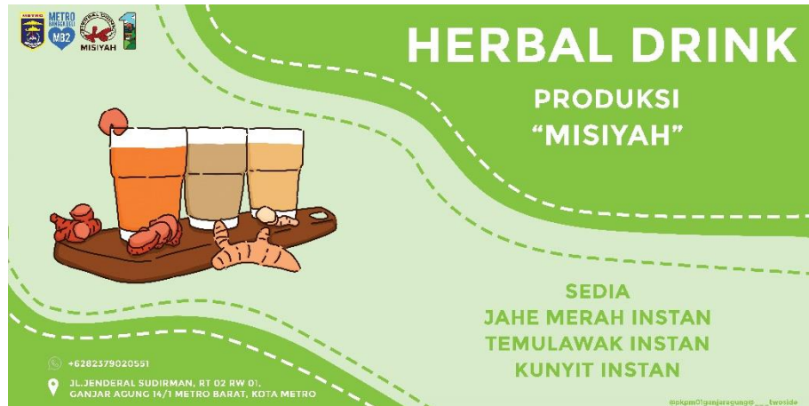
Gambar 2. 2 Desain Logo UMKM Herbal Drink