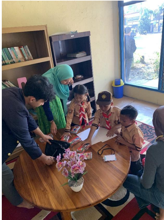
Gambar 2. 5 Kegiatan Rumah Pintar Anak Kelurahan Ganjar Agung