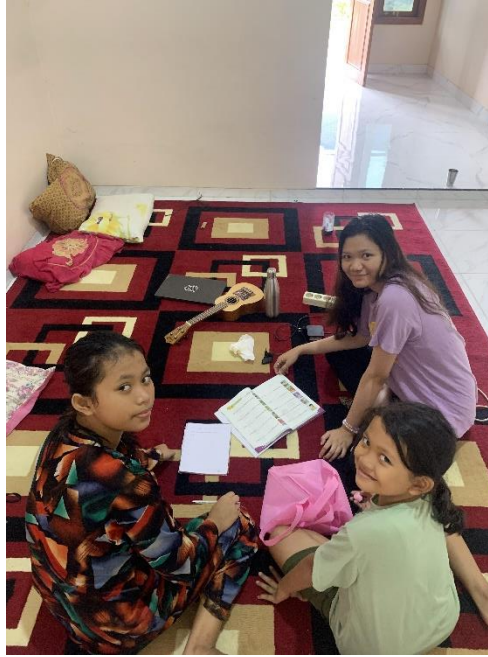
Gambar 2. 6 Bimbel Gratis bagi anak Kelurahan Ganjar Agung