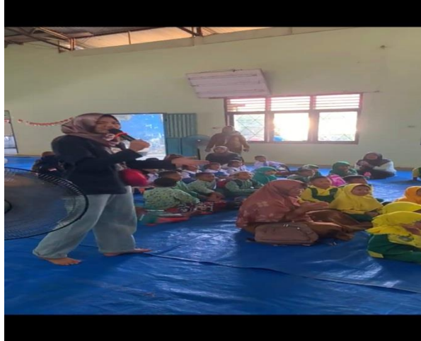
Gambar 2. 1 Sosialisasi Forum Anak

dengan memberikan materi tentang pentingnya belajar dan satu hari tanpa gadget serta melakukan beberapa aktivitas lainnya yang membangun anak-anak menjadi anak yang tidak malu di depan publik atau komunitas, contoh kegiatannya seperti bernyanyi dan menari bersama.