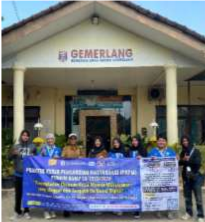
Penyerahan Mahasiswa PKPM Ke Kelurahan