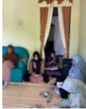
Pengajian BMKT Permata Kelurahan Purwosari