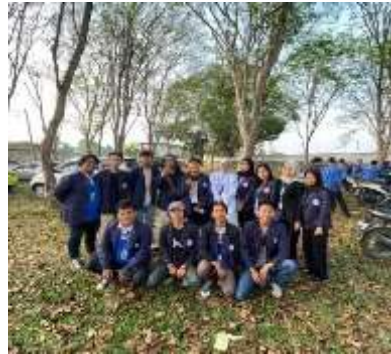
Upacara HUT RI ke – 79