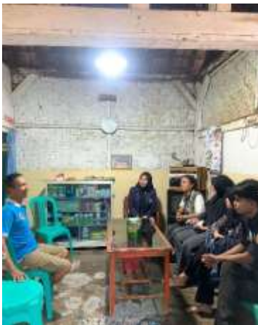
Silaturahmi ke kediaman RW yang ada di lingkungan Purwosari