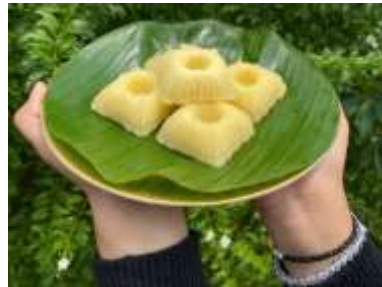
Foto Produk Cireng PMJ UMKM Dapur Umza