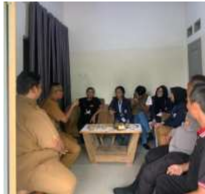
Kunjungan ke UMKM Dapur Umza