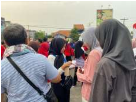
Membantu kegiatan jalan sehat dan karnaval budaya bersama Kelurahan Purwosari dan MST