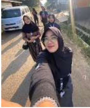
Senam Pagi Bersama LLI (Lembaga Lanjut Usia Indonesia)