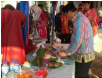
Menghadiri Acara Royokan