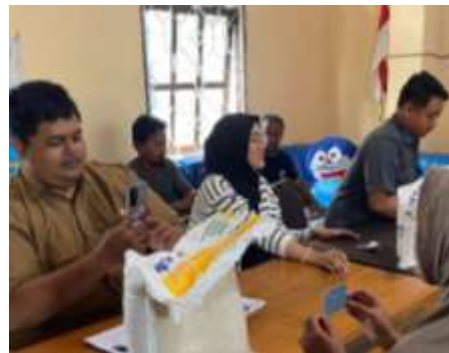
Menghadiri Acara Simbolis Pembagian Beras CPP