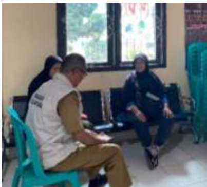
Piket Rutin Kelurahan