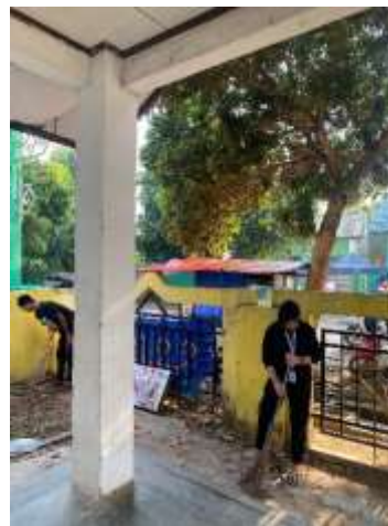
Gotong Royong di Kelurahan Purwosari