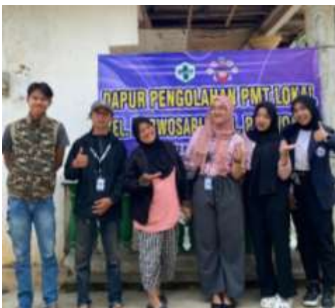
Kunjungan ke UMKM Dapur Oishi