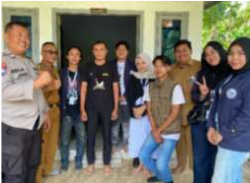
Kunjungan ke UMKM Dapur Umza