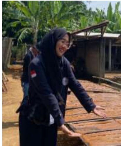
Kunjungan ke UMKM Kerupuk mentah