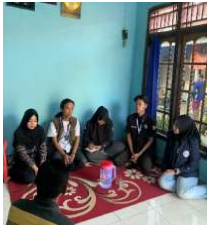
Silaturahmi ke kediaman RW yang ada di lingkungan Purwosari