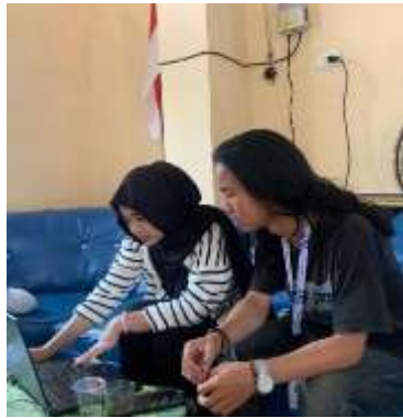
Proses Penginputan Data Penduduk Kelurahan Purwosari