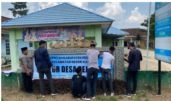
Lampiran 1.9 Pemasangan Banner di Balai Desa