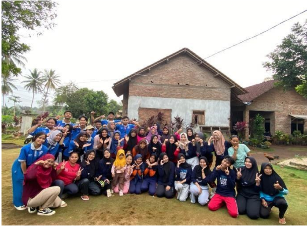
Lampiran 1.13 Senam bersama dengan Ibu-ibu di Dusun 3