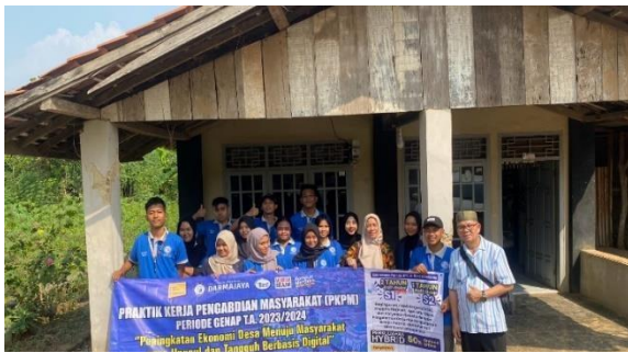
Lampiran 1.3 Pengantaran Mahasiswa