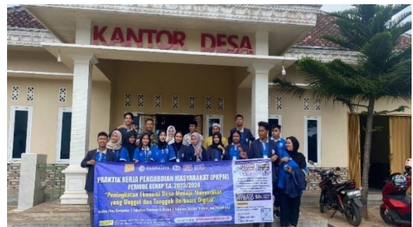
Lampiran 1.4 Penerimaan Mahasiswa PKPM di Balai Desa