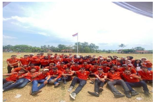
Lampiran 1.16 Perlombaan dengan Karang Taruna