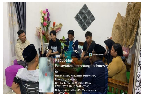
Lampiran 1.6 Kunjungan ke Rumah Kepala Dusun 5