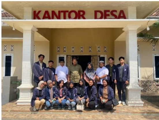
Lampiran 1.1 Survei lokasi PKPM