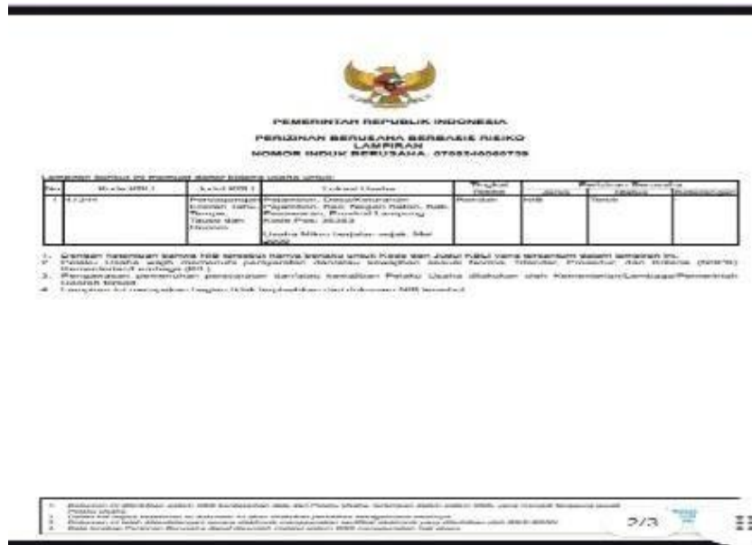
Gambar 2.4 Nomor induk berusaha Tahu Tempe pak royani