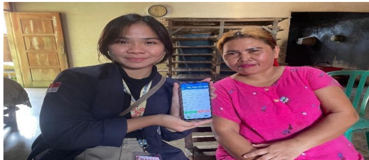
2.2 Gambar hasil Edukasi pengelolaan keuangan melalui aplikasi buku kas

Proses penggunaan aplikasi buku kas ini diharapkan dapat memberikan manfaat yang positif dan dapat memberikan pengaruh terhadap pencatatan dan pengelolaan keuangan pada umkm tahu tempe Pak Royani dan meningkatkan penjualan dari umkm tahu tempe pak Royani.